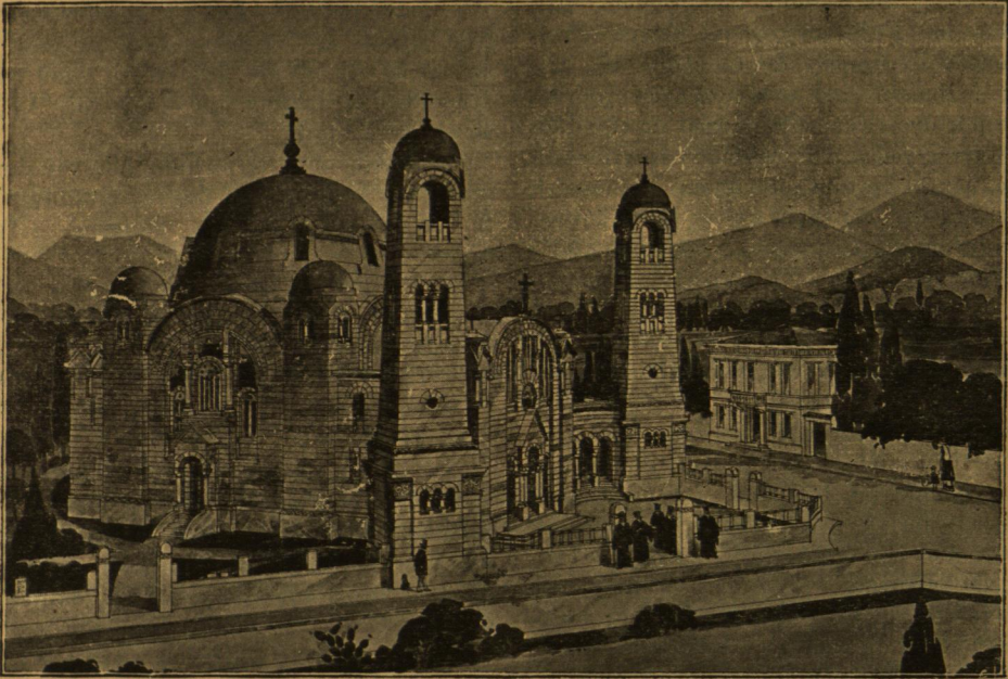
Εἰκὼν 1. — Ἄποψις.

Ἐπὶ τοῦ καλλιτεχνικοῦ μέρους καθὼς καὶ τοῦ τεχνικοῦ ὁ κ. Durm (καθηγητὴς τοῦ ἐν