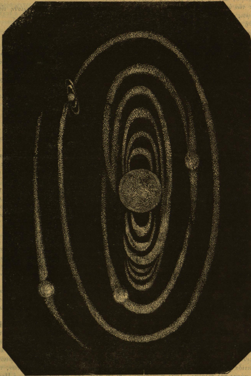
ΣΧΗΜΑΤΙΣΜΟΣ ΤΟΥ ΗΛΙΑΚΟΥ ΣΥΣΤΗΜΑΤΟΣ ΚΑΤΑ ΤΟΝ LAPLACE

Ἀπέναντι τῶν ἐρευνῶν τούτων αἰτίνας ἀποσύρουντι