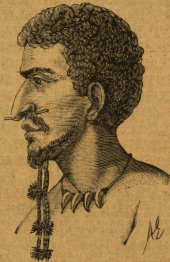
Αὐτόχθων τῆς Γουινέας.

Αἱ ταξινομίαι τῶν ἀνθρωπίνων φυλῶν λαμβάνουσιν ὡς βάσιν τοὺς φυσικοὺς χαρακτῆρας ὡς τὴν φύσιν τῶν τριχῶν, τὸ χροῖμα τοῦ δέρματος, τὸν σχηματισμὸν τοῦ κρανίου καὶ τὸν τῆς ρινός· ἀλλὰ τὸ πλεῖστον τῶν ταξινομιῶν τούτων μόνον τὴν βάσιν ἔχουσιν ἐπιστημονικὴν, εἰσερχόμεναι δὲ εἰς τὰς δευτερευούσας διαιρέσεις καθίστανται μᾶλλον ἢ ἥττον κηλίετοι. Κατὰ τοὺς τελευταίους τούτους χρόνους ἡ ἀνθρωπολογία κατέστη εἰδικὴ ἐπιστήμη φωτιζομένη διὰ τῆς ἐθνολογίας, τῆς γλωσσολογίας, τῆς ἱστορίας. Ἀλλ' ὅμως πολλὰ αὐτῆς σημεῖα μένουσιν ἔτι ἐν τῷ σκότει.