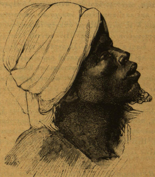
Αὐτόχθων τοῦ Darfour

Ἄφ' ἐτέρου αἱ γλυφαὶ καὶ αἱ γραφαὶ τῶν Αἰγυπτιακῶν μνημείων ἀποδεικνύουσιν ἡμῖν ὅτι οἱ εἰδικοί χαρακτήρες ἐκαστῆς φυλῆς εἰσὶν ἴδιοι καὶ ἀνεξίτηλοι καὶ οὐδαμῶς ἀνέκουσιν εἰς τὸ κλίμα, ἢ μᾶλλον ἡτῶν ἀνθρώπων διασπορὰ ἐπὶ τῆς γῆς ἀνέρχεται εἰς χρόνους ἀρχαιοτάτους· τοῦτο δ' ἄλλως θὰ συνεφῶνει οὐ μόνον πρὸς τὰς ἀρχαιοτάτας ἱστορικὰς παραδόσεις τῆς Αἰγύπτου, ἀλλὰ καὶ πρὸς τὰς νεωτέρας γεωλογικὰς ἀνακαλύψεις.