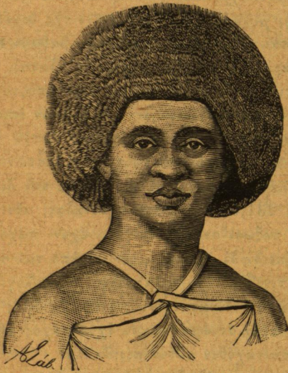
Γυνὴ τῆς Γουινέας

Ἄπο μακροῦ ἀνεκινήθη τὸ ζήτημα ἐὰν αἱ διαφοροὶ ἀνθρώπιναι φυλαὶ ἀνήκουσιν εἰς ἓν εἶδος ἢ ἂν ἐκαστὴ χώρα κέκτηται τὰ ἰδιάζοντα αὐτῆς εἶδη πο-