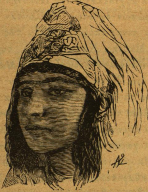
Γυνὴ τοῦ Khartoum

νομικούς τινες σχηματισμούς αποτελούντας τὰς φυλάς ἢ τὰς ποικιλίας». — Κυρίως εἰς τὸ χροῖμα τοῦ δέρματος καὶ τὴν σπουδὴν τοῦ ἀνθρωπίνου κρανίου στηρίζονται αἱ διακρίσεις αἱ γινόμεναι δεχταὶ ὑπὸ τῶν φυσιοδιφῶν. Ἀπὸ μακροῦ ἤδη χρόνου παρατηρήθη ὅτι