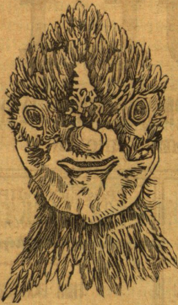
Κεφαλή θεωμένη κατ' ὄψιν.

λης ἀλεκτορίδος, ἐξαγριούται καὶ μάχεται ὡς ὁ ἀλέκτωρ· ὅταν δ' ἴδῃ ἀλέκτορα καταλαμβάνεται ὑπὸ δέους καὶ ἀμέσως κούπτεται. Ἀποφεύγει τὸν ἥλιον κρυπτομένη ἢ εἰς τὰ χόρτα ἢ καταφεύγουσα εἰς τὸ