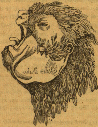
Κατὰ κρόταφον μετ' ἀνοικτοῦ ράμφους.

μαγειρεῖον. Τὸ ζῷον τοῦτο ἀγαπᾷ εἰς ἄκρον τὴν μετ' ἀνθρώπων συμβίωσιν. Οἱ πόδες αὐτῆς εἶνε παχύτατοι, ἰσχυρότατοι καὶ καλύπτονται ὑπὸ λεπῶν σκληρῶν καὶ πυκνῶν, στερεῖται ὀνύχων κατὰ τοὺς μεγάλους δακτύ-