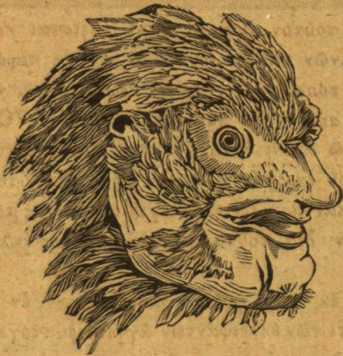
Κεφαλή θεωμένη κατὰ κρόταφον μετὰ κεκλεισμένου ράμφους