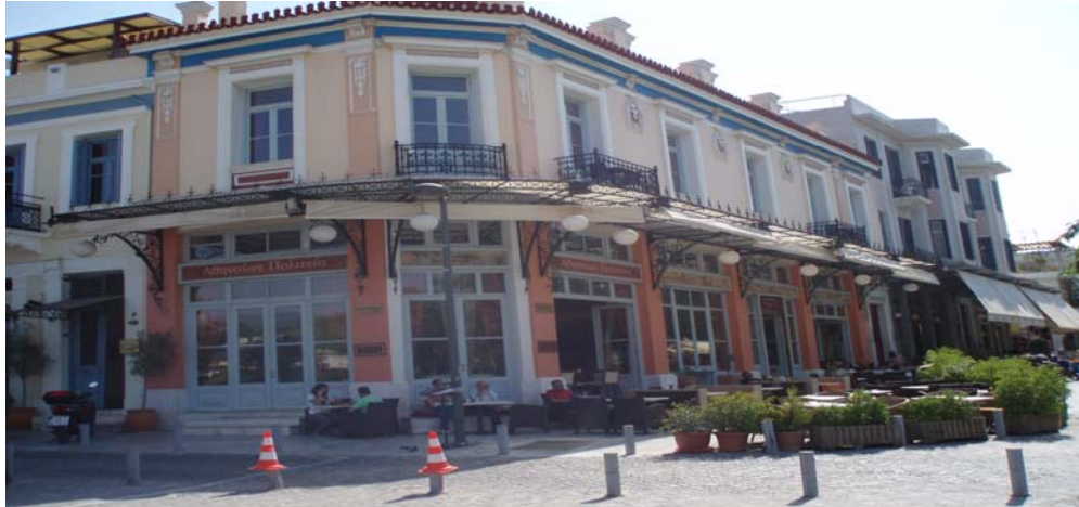
Εικόνα 15 Χώρος Αναψυχής στον πεζόδρομο της οδού Ηρακλειδών ( Διόροφο κτίσμα )

Συγκεντρώνει πολλούς επισκέπτες οι οποίοι διασχίζοντας τμήμα της Απ. Παύλου καταλήγουν στις καφετέριες του πεζόδρομου.