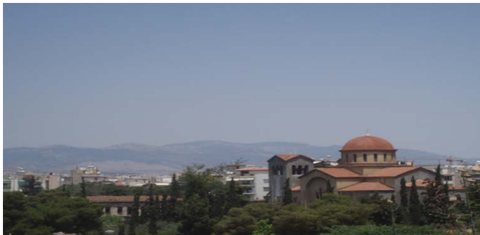
Εικόνα 18 Οπτική φυγή στον Πεζόδρομο της οδού Επταγάλκου

Όπως αναφέρθηκε και πιο πάνω λόγω της υπερυψωμένης θέσης της προσφέρει στους κατοίκους οπτική επαφή με το χώρο του Κεραμεικού και του Γκαζίου.