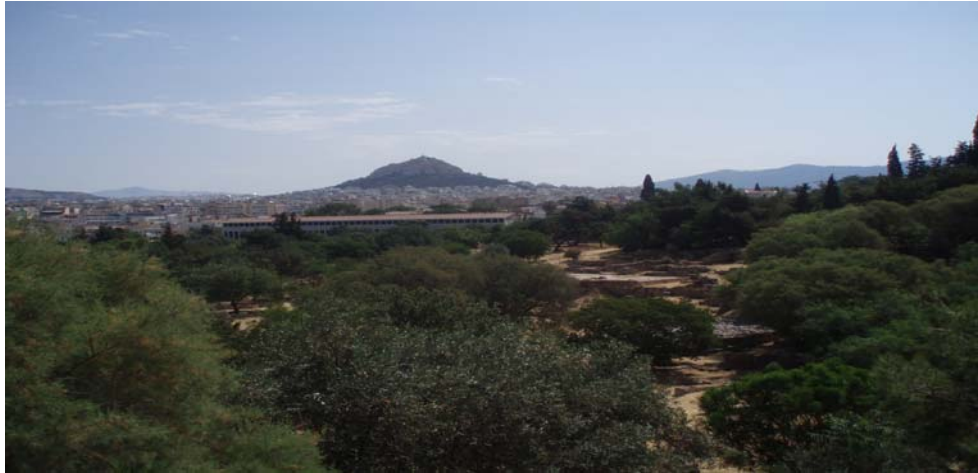
Εικόνα 17 Οπτική φυγή στην συμβολή των οδών Ακαμάντος - Νηλέως

Ανατολικά της Απ. Παύλου και στην συμβολή των οδών Ακάμαντος και Νηλέως υπάρχει ένα δεύτερο σημείο αναφοράς για την περιοχή μελέτης. Ο χώρος αυτός έχει θέαση στους αρχαιολογικούς χώρους και κυρίως συνδέεται με την υπερτοπική αναψυχή της περιοχής.