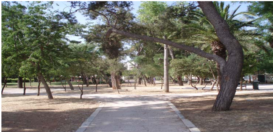
Εικόνα 16 Περίγυρος χώρος στο Σταθμό του Θησείου

Στην περιοχή υπάρχουν κάποια βασικά σημεία αναφοράς (κομβικά σημεία), μέσω των οποίων δίνεται η δυνατότητα στον επισκέπτη να εισέλθει στην περιοχή δεδομένου, όπως αναφέρθηκε και πιο πάνω, στην περιοχή υπάρχουν τεχνικά φράγματα που την εγκλωβίζουν. Ο ηλεκτρικός σταθμός κατά μήκος της οδού Θεσσαλονίκης και ο πεζόδρομος επί της οδού Απ. Παύλου. Εκτός από την πλατεία Αφαίας που αναφέραμε, ένα βασικό σημείο αναφοράς αποτελεί ο σταθμός του Θησείου με τον γύρω χώρο.