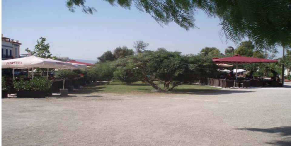
Εικόνα 11 Χώρος με Τράπεζο- καθίσματα επί της Απ. Παύλου

Ο πεζόδρομος επί της οδού Απ. Παύλου είναι γεμάτος με τραπεζοκαθίσματα που εξυπηρετεί τους επισκέπτες της περιοχής καθώς και τους τουρίστες.