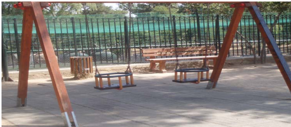
Εικόνα 10 Χώρος Άθλησης ( Παιδική χαρά-Γήπεδο)

Είναι ένας περιφραγμένος χώρος με την είσοδό του από την πλευρά του σταθμού και λόγω της γεώτρησης που υπάρχει εκεί καλύπτει μεγάλο μέρος ποτίσματος διαφόρων δημοσίων χώρων.