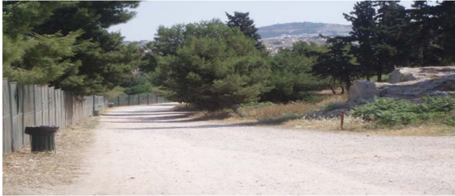
Εικόνα 9 Είσοδος στον Κήπο του Θησείου

Είναι ένας περιφραγμένος χώρος με την είσοδό του από την πλευρά του σταθμού και λόγω της γεώτρησης που υπάρχει εκεί καλύπτει μεγάλο μέρος ποτίσματος διαφόρων δημοσίων χώρων.