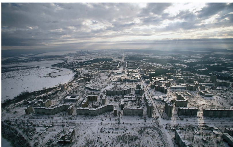
Εικ.4. Pripyat, Ουκρανία εγκαταλελειμμένη από το 1986 μετά το πυρηνικό ατύχημα στο Chernobil

του κινηματογράφου: τα στοιχειωμένα κτήρια δεν είναι παρά η προβολή του φόβου του ανθρώπου να επισκέπτεται μέρη που έχουν κατοικηθεί και μετά αφέθηκαν να ρημάζουν. Ένας χώρος που φιλοξένησε τη ζωή (δοχείο ζωής) και τώρα μένει άδειος φαντάζει μελαγχολικός και μυστήριος. Ό,τι αδυνατεί να απαντηθεί αναγορεύεται “μυστικό” και η σιωπή είναι αυτή που το κρύβει: “Ποιοί να έζησαν εδώ; Πώς να ήταν η ζωή τους; Πόσες ζωές να ξεκίνησαν και να τελειώσαν εδώ; Γιατί το εγκατέλειψαν;”. Η απουσία της ζωής μας ωθεί να αναπαραστήσουμε νοητά σενάρια (φανταστικά, ή πραγματικά αν το μέρος μας είναι γνώριμο) · απόδειξη της υποκειμενικότητας της εμπειρίας από την επίσκεψη ενός ερειπίου. “Εδώ, που η απουσία διαδέχεται την παρουσία , και η σιωπή καθορίζει τη ψευδαίσθηση του ήχου, το Τίποτα (the Nothing) βγαίνει από το λήθαργο”. 15