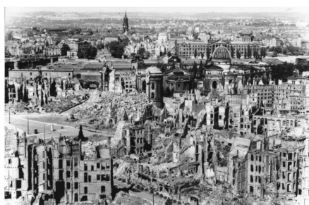
Εικ.1. Δρέσδη, μετά τους βομβαρδισμούς του Β΄ Παγκοσμίου Πολέμου

Ωστόσο, η ερείπωση δεν ταιριάζει πάντοτε στα κτήρια: στις περιπτώσεις ξαφνικής και βίαιης ερείπωσης -από τον άνθρωπο ή την φύση- (π.χ. από βομβαρδισμό, πυρκαγιά, έκρηξη, τυφώνα, σεισμό, υποχώρηση του εδάφους) η καταστροφή του κτηρίου είναι πολύπλευρη (δομική, αισθητική, νοηματική). Ένα καλό παράδειγμα τέτοιας περίπτωσης αποτελούν τα ερείπια της Δρέσδης από τους βομβαρδισμούς στο τέλος του Β΄ Παγκοσμίου Πολέμου (εικόνες 1, 2α, 2β).