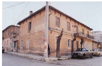
Εικ.3α και Εικ.3β Προσφυγικές κατοικίες στην Καισαριανή