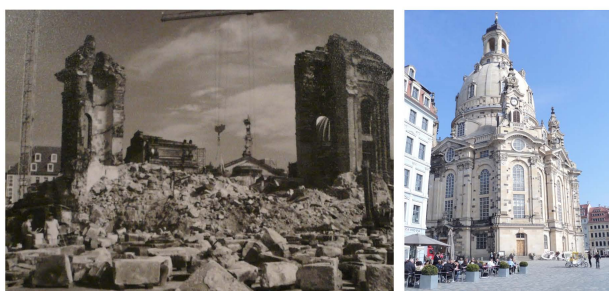
Εικ.2.α. και Εικ.2.β. Εκκλησία Frauenkirche, Δρέσδη, βομβαρδισμένη (1945), και αποκατεστημένη (2005).

Φαίνεται λοιπόν ότι εκτός από την αρχική αισθητική αξία των κτηρίων, η ποικιλία στον τρόπο με τον οποίο ερειπώνονται (αίτιο και διαδικασία-διάρκεια) οδηγεί στη δημιουργία μοναδικών περιπτώσεων- ποτέ δύο ερείπια δεν είναι ίδια- που διαφέρουν ως προς το βαθμό εναρμόνισής τους με την φύση, το αισθητικό αποτέλεσμα και την αίσθησης-συναίσθημα που προκαλούν στον επισκέπτη. Κατ’έκταση, η σύγκριση ερειπίων είναι κατά κάποιο τρόπο αθέμιτη, δεδομένης της διαφορετικής αφητηρίας αλλά και της πορείας τους.