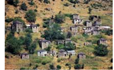
εικ.7: οικισμός Ζέρμα, Ν. Ιωαννίνων