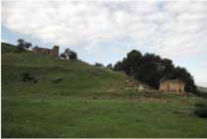
εικ.3: Άγιος Θεόδωρος Τηλλυρίας, πρώην τ/κ οικισμός