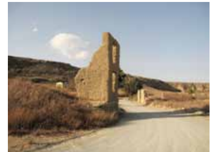
εικ.31: Άγιος Σωζόμενος, ερείπια κατοικιών