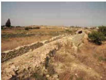
εικ.33: παλιός νερόμυλος στην είσοδο του οικισμού