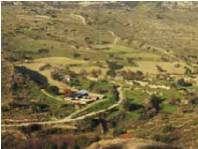
εικ.53: Κιβίδες Λεμεσού: ο οικισμός παραμένει μέχρι σήμερα εγκαταλελειμμένος και δυσπρόσιτος

Παρόλα αυτά, η επανένταξη οικισμών στη σύγχρονη ζωή μπορεί να γίνει με διάφορους τρόπους, πέραν της επανακατοίκησης. Η ιστορική και αρχιτεκτονική τους αξία ή το ιδιαίτερο φυσικό τους περιβάλλον μπορούν να αποτελέσουν προϋποθέσεις αξιοποίησής τους, προσανατολισμένης στον ειδικό τους χαρακτήρα.