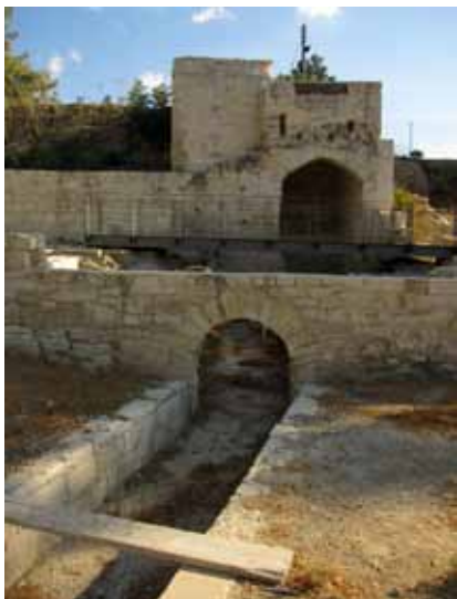
εικ.32: αρχαίος νερόμυλος αποκατεστημένος μεταξύ Δαλιού και Ποταμιάς