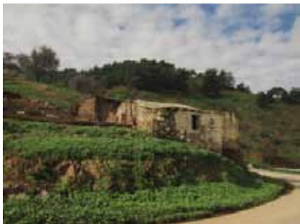
εικ.2: Αλεύγα, πρώην τ/κ οικισμός στην περιοχή Τηλλυρίας, επαρχία Λευκωσίας