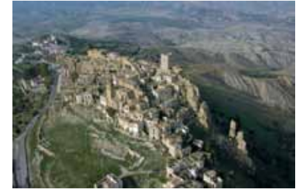
εικ.1: Craco, εγκαταλελειμμένο μεσαιωνικό χωριό στην Ιταλία

Η εγκατάλειψη οικισμών συνδέεται σε γενικές γραμμές με αίτια κοινωνικά, πολιτικά, οικονομικά, περιβαλλοντικά, τα οποία μεταβάλλονται ανάλογα με τη χρονική περίοδο και την εκάστοτε περιοχή