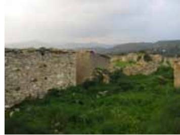
εικ.6: οικισμός Δράπια, επαρχία Λάρνακας

στο http://el.wikipedia.org/wiki/Αρκουδόρρεμα_Αρκαδίας , προσπ. 08-12-12, γ) Pueblos Abandonados, «Talavera la Vieja», διαθέσιμο στο: http://www.pueblosabandonados.com/2009/12/talavera-la-vieja-caceres.html , προσπ. 11-11-12]