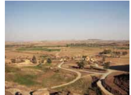
εικ.30: Άγιος Σωζόμενος, πανοραμική άποψη του οικισμού

Η περιοχή αποτελεί αγροτικό τοπίο, με μεγάλες εκτάσεις καλλιεργήσιμης γης, που αξιοποιούνται για γεωργικούς και κτηνοτροφικούς σκοπούς. Συγχρόνως αναπτύσσεται λατομική δραστηριότητα εξόρυξης ασβεστολιθικού ψαμίτη από τα λατομεία Λατούρος και ΕΛΜΕΝΙ, ενώ στα βόρεια του οικισμού υπάρχει σταθμός επεξεργασίας/ βιολογικού καθαρισμού λυμάτων. Στην περιφέρειά του, προς τα βόρεια, υπάρχουν στρατιωτικές εγκαταστάσεις της Εθνικής Φρουράς που υπολειπονται. Σε μέγιστη ακτίνα 6 χιλιομέτρων απαντώνται τα οικιστικά σύνολα τριών κοινοτήτων: της Ποταμιάς, του Πέρα Χωριού-Νήσου και του Γερίου, καθώς και του Δήμου Ιδαλίου 23 .