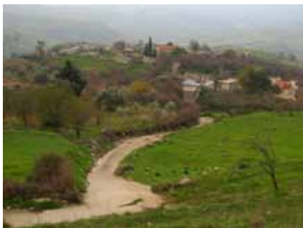
εικ.5: Άγιος Φώτιος, εγκαταλελειμμένο ε/κ χωριό στην επαρχία Πάφου