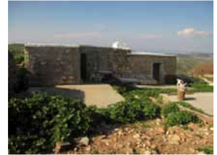
εικ.54: κατοικία υπό ανακαίνιση στο Φάσλι, στην επαρχία Πάφου

Σε εξαιρετικές περιπτώσεις, ο Κηδεμόνας μπορεί να παραχωρεί άδεια σε Τουρκοκύπριους ιδιοκτήτες που ενδιαφέρονται για την αποδοχή πώλησης περιουσιών τους, εφόσον πληρούν κάποιες προϋποθέσεις, με βασικό κριτήριο την αποφυγή εκμετάλλευσης της έκρυθμης κατάστασης ή και πρόκλησης οποιασδήποτε αναταραχής στους Ε/Κ πρόσφυγες που χρησιμοποιούν προσωρινά τις περιουσίες αυτές. Η προώθηση και εξέταση αιτημάτων αγοραπωλησίας Τ/Κ περιουσίας, προϋποθέτει την αποδεδειγμένη μετάβαση και μόνιμη εγκατάσταση των Τ/Κ ιδιοκτητών στο εξωτερικό πριν την τουρκική εισβολή, καθώς και την μέχρι στιγμής διαμονή τους στο εξωτερικό ή στις ελεύθερες περιοχές. Οι περιουσίες που υπερβαίνουν τις €341.720,29 σε κόστος υποβάλλονται για έγκριση στο Υπουργικό συμβούλιο. Εξαιρούνται κάποιες περιπτώσεις κατά τις οποίες ο Κηδεμόνας μπορεί να εγκρίνει την αγοραπωλησία Τ/Κ περιουσίας της οποίας ο ιδιοκτήτης έγινε μόνιμος κάτοικος εξωτερικού μετά το