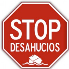
Σταματήστε τις εξώσεις