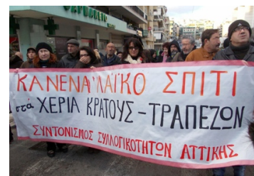
Συνθήματα και δράσεις ενάντια σε πλειστηριασμούς