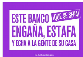
Αυτή τη τράπεζα κοροϊδεύει