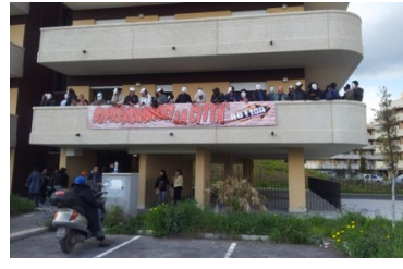
Ταυτόχρονη κατάληψη 10 κτιρίων στη Ρώμη: "Tsunami Tour", 7/4/2013