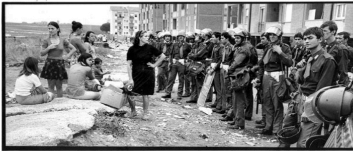
Roma 1974 San Basilio