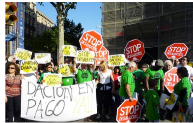
Δράση παρεμπόδισης έξωσης της PAH στη Βαρκελώνη