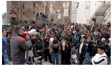
Δράσεις της οργάνωσης ACTION (πηγή: ιστοσελίδες της οργάνωσης)