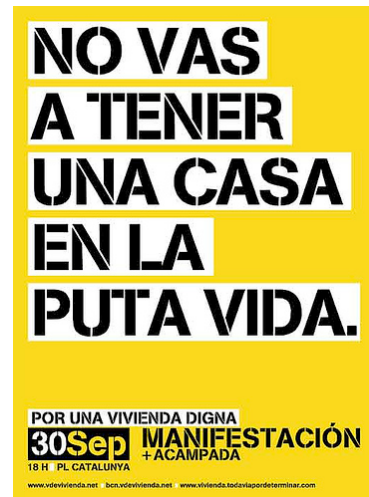
Αφίσες και συνθήματα του κινήματος για αξιοπρεπή κατοικία στην Ισπανία το 2006