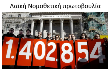
Λαϊκή Νομοθετική πρωτοβουλία