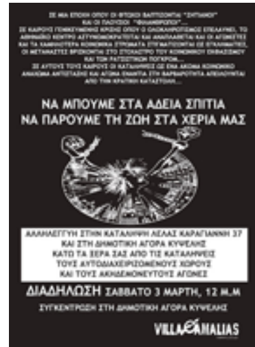
Αφίσες και συνθήματα του κινήματος καταλήψεων στην Αθήνα