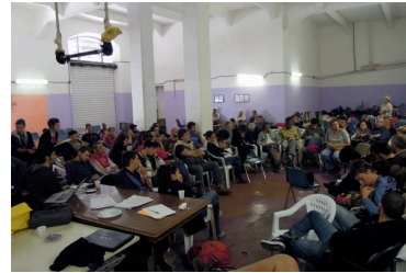
Κατάληψη Porto Fluviale