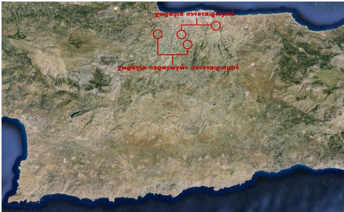
Τα χωράφια του συνεταιρισμού στο νομό Ηρακλείου