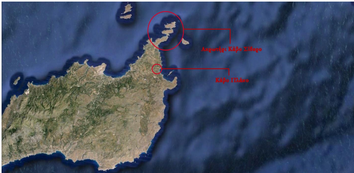
Οι εκτάσεις των δύο σύνθετων τουριστικών επενδύσεων στο Κάβο Σίδηρο και Κάβο Πλάκο