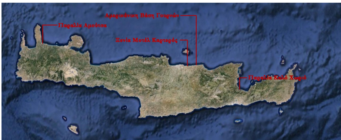
Οι τέσσερις παράκτιες εκτάσεις που έχουν υπαχθεί στο ΤΑΙΠΕΔ

Η υπαγωγή στο ΤΑΙΠΕΔ της πανέμορφης παραλίας της Αμούτσας στην βόρεια ακτή των Χανίων έκτασης 18.382 τ.μ., και της παρθένας παραλίας του Καλού Χωριού στη βόρεια ακτή του νομού Λασιθίου έκτασης 46.942 τ.μ. (eKriti 2014), απαλλοτριώνουν μέρος του συμβολικού κεφαλαίου του νησιού, εμπορευματοποιώντας την καθαρότητα των νερών για την εξασφάλιση μονοπωλιακών γαιοπροσόδων.