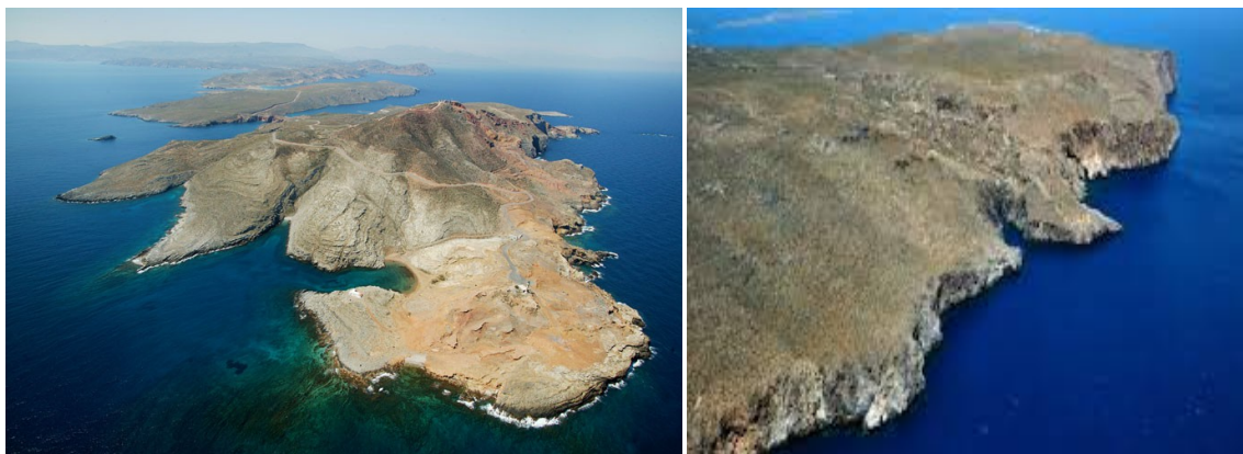
Το Κάβο Σίδηρο και το Κάβο Πλάκο

Η υλοποίηση των παραπάνω επενδύσεων πρόκειται να υφαρπάξει τεράστιες εκτάσεις σπάνιας ομορφιάς, αφαιρώντας το πολύτιμο οικοσύστημα μιας φρυγανώδους ορεινής έκτασης για την κατασκευή γηπέδου γκολφ, και τις απομονωμένες ακτές που την περιστοιχίζουν για την αντιληπτική απομόνωση των πλούσιων επισκεπτών της. Επιπρόσθετα όμως, πρόκειται να υφαρπάξουν τις μοναδικές αναπαραστάσεις του τόπου και τις φυσικές διεργασίες αιώνων που δημιούργησαν το μοναδικό άνυδρο τοπίο, κεφαλαιοποιώντας έτσι τον πολιτισμό που είναι ενσωματωμένος σε αυτό, για την εξασφάλιση και πάλι μονοπωλιακών γαιοπροσόδων (Χατζημιχάλης 2014).