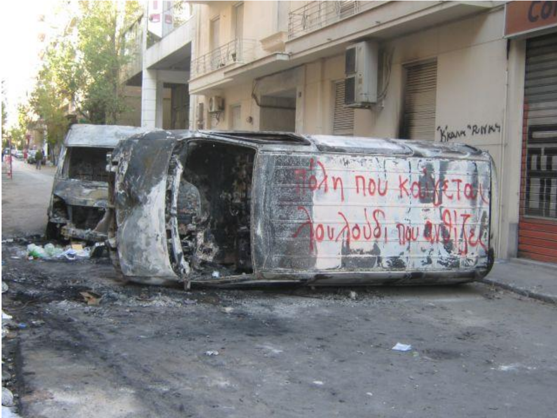
Εικόνα 12. Οδοφράγμα με καμένα οχήματα σε ένα από τα οποία γράφτηκε: "Πόλη που καίγεται, λουλούδι που ανθίζει"

Κατά τις πρώτες μέρες, η εξέγερση εκφράστηκε κυρίως στους δρόμους. Στήθηκαν οδοφράγματα και έγιναν διαδηλώσεις σε πολλούς κεντρικούς δρόμους της Αθήνας. Οι δημόσιοι χώροι (δρόμοι και πλατείες) «φιλοξένησαν» τις μάχες με την αστυνομία. Η παρουσία των ανθρώπων στο δρόμο δημοσιοποίησε την έναρξη και γνωστοποίησε τις θέσεις της εξέγερσης. Οι δρόμοι μπορεί να συνιστούν καθημερινά κανάλια ροής εμπορευμάτων, εύκολα μετατρέπονται όμως σε κανάλια ροής συγκρούσεων, γιατί πρωτίστως είναι δίοδοι επικοινωνίας και χώροι συνάντησης ανθρώπων. 103 Το κατέβασμα στο δρόμο, αποτελεί τον πιο ξεκάθαρο τρόπο εναντίωσης στην αστυνομική βία και η μαζικότητα των κινητοποιήσεων στους δρόμους δείχνει ότι το ζήτημα αφορά πολλούς και πολλές. Άτομα της κατάληψης της Νομικής σχολής έγραψαν: «Ο κόσμος έγινε δρόμος και ο δρόμος έγινε κόσμος. Άνθρωποι κάθε ηλικίας κατεβαίνουν στο δρόμο και δηλώνουν το παρόν τους σε μία κοινωνία που νιώθουν ότι από καιρό σφυρίζει αδιάφορα και αγνοεί την ύπαρξή τους». 104