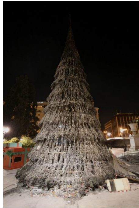
Εικόνα 3. Το δέντρο κατά τη διάρκεια του εμπρησμού του σε αφίσα της κατάληψης ΑΣΟΕΕ, πηγή: Εξέγερση οδοιπορικό, https://athens.indymedia.org/