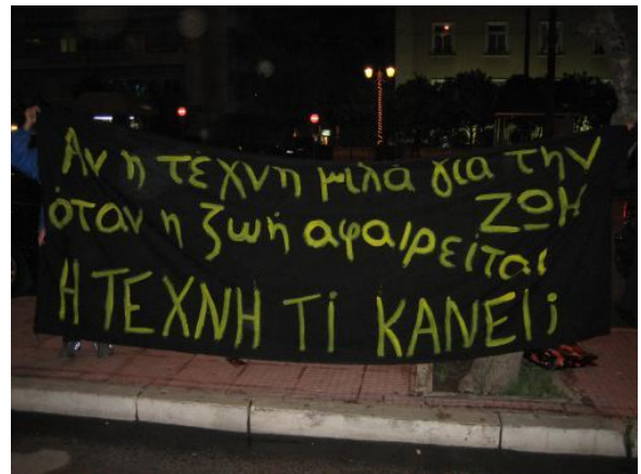
Εικόνα 16. Παρέμβαση σε πρεμιέρα του Εθνικού Θεάτρου στις 19 Δεκεμβρίου 2008