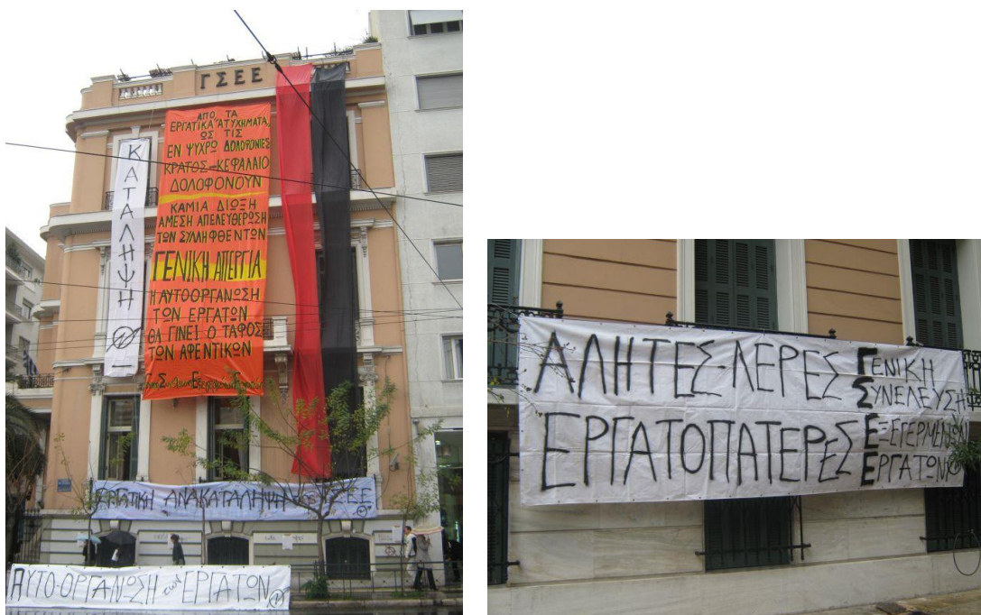
Εικόνες 14, 15. Η κατειλημμένη ΓΣΕΕ

Οι χειρώνακτες εργάτες, υπάλληλοι, άνεργοι, προσωρινοί, ντόπιοι και μετανάστες όπως αυτοκαθορίστηκαν αποφάσισαν να καταλάβουν το κτίριο της ΓΣΕΕ για να το μετατρέψουν σε χώρο ελεύθερης έκφρασης και συνάντησης εργατών, να δείξουν ότι και οι εργάτες είναι παρόντες στην εξέγερση και ότι αυτή δεν αποτελεί ζήτημα 500 κουκουλοφόρων, να στηλιτεύσουν και να αποκαλύψουν το ρόλο της συνδικαλιστικής γραφειοκρατίας στην υπονόμευση της εξέγερσης. Επιχείρησαν ακόμη να ανοίξουν αυτό το χώρο – ως συνέπεια του κοινωνικού ανοίγματος που δημιούργησε η εξέγερση- από τον οποίο ένιωθαν αποκλεισμένοι. Οργάνωσαν λοιπόν από την αρχή μια άλλη δομή, έναν χώρο στον οποίο δινόταν η δυνατότητα συνάντησης, συζήτησης και οργάνωσης. Στην απογευματινή συνέλευση που καλέστηκε συμμετείχαν 800 άτομα. Στην πρώτη τους ανακοίνωση μεταξύ άλλων αναφέρουν: «Πρέπει να αποκτήσουμε φωνή, να βρεθούμε, να μιλήσουμε να αποφασίσουμε και να δράσουμε. Ενάντια στη γενικευμένη επίθεση που βρισκόμαστε. Η δημιουργία συλλογικών αντιστάσεων «από τα κάτω» είναι μονόδρομος. Να προωθήσουμε την ιδέα της αυτοοργάνωσης και της αλληλεγγύης στους χώρους δουλειάς, τις επιτροπές αγώνα και τις συλλογικές διαδικασίες βάσης καταργώντας τους γραφειοκράτες συνδικαλιστές». 113 Η κατάληψη του κτιρίου της ΓΣΕΕ έληξε την Κυριακή 21/12 μετά από εκδήλωση για την οργάνωση της αλληλεγγύης στους συλληφθέντες και τους φυλακισμένους. Ακολούθησε πορεία που κατευθύνθηκε μέσω της Πατησίων και της Σολωμού προς την κατάληψη του Πολυτεχνείου.