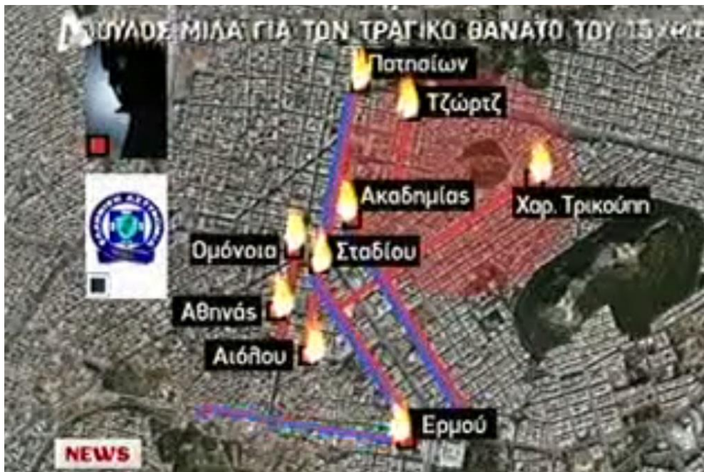
Εικόνα 2. Τα σημεία των ταραχών το πρώτο βράδυ της εξέγερσης