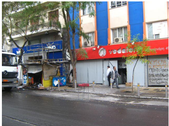
Εικόνα 8. Σπασμένο υποκατάστημα τράπεζας