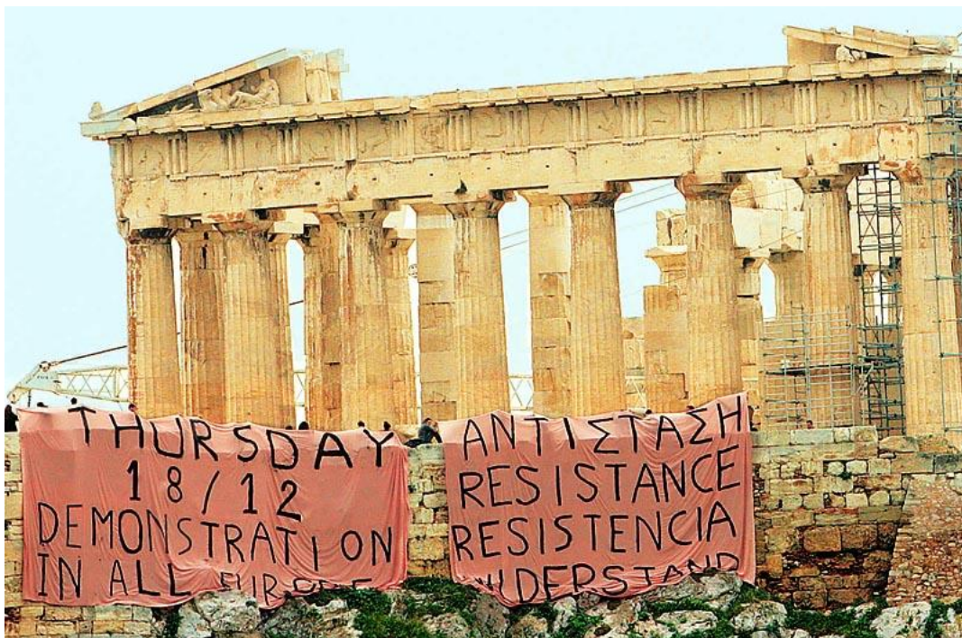
Εικόνα 13: Τα πανό στην Ακρόπολη

Το παλιό δημαρχείο Χαλανδρίου είναι ένα γωνιακό κτίριο λίγο πιο πέρα από την κεντρική πλατεία του Αγίου Γεωργίου. Σήμερα στεγάζει ένα από τα ΚΕΠ του δήμου στο ισόγειο και στον πρώτο όροφο την αίθουσα συνεδριάσεων του δημοτικού συμβουλίου. Η κατάληψη του ΚΕΠ ξεκίνησε στις 12 Δεκεμβρίου και έληξε το Σάββατο 20 Δεκεμβρίου. Κατά τη διάρκεια της κατάληψης πραγματοποιήθηκε πλήθος εκδηλώσεων, οι οποίες στόχευαν κυρίως στο να γίνει η κατάληψη εστία αντιληροφόρησης και παρέμβασης σε τοπικό επίπεδο (με μοιράσματα κειμένων, μικροφωνικές, παρεμβάσεις στους εμπορικούς δρόμους κ.ά.), αλλά και ομιλίες, διαλέξεις, προβολές καθώς και η οργάνωση δύο πορειών στο κέντρο του Χαλανδρίου.