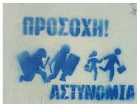
Εικόνα 5. Προσαγωγή τις μέρες του Δεκέμβρη, πηγή: Εξέγερση Οδοιπορικό, https://athens.indymedia.org/