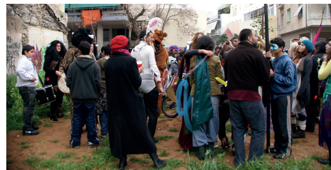
σε αδόμητο οικόπεδο, ΚτΜ 2011, πηγή: Αθηνά Σταματοπούλου

σημεία που σε καθημερινές συνθήκες φιλοξενούν πολύ λιγότερο πληθυσμό (Δημόσιο Σήμα, πεζόδρομοι, αυλές σπιτιών μελών του ΚτΜ). Από την άλλη, την ημέρα διεξαγωγής της γιορτής παρατηρείται η συγκέντρωση μεγάλου αριθμού υποκειμένων σε διάφορα σημεία της περιοχής, μερικά από τα οποία παραμένουν σταθεροί χώροι παύσης για το ΚτΜ ανά τα χρόνια. Η επιλογή των σημείων αυτών έχει κυρίως να κάνει με την ανοιχτότητα του εκάστοτε χώρου (Δημόσιο Σήμα, οδός Μεγάλου Αλεξάνδρου, Chinatown, οδός Κεραμεικού, πλατεία Αυδή), με τις δραστηριότητες που συνδέονται με κάθε ένα από αυτά (Chinatown, Δημόσιο Σήμα, πλατεία Αυδή) αλλά και με τον μεγάλο αριθμό πολυσύχναστων κέντρων εστίασης που στεγάζονται στις γύρω περιοχές.