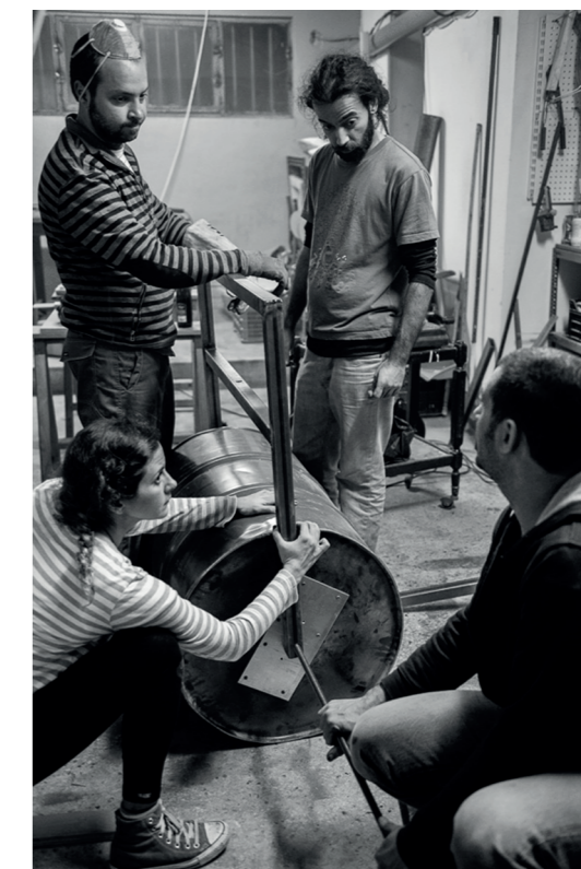
Κατασκευή χειροκίνητου άρματος, Μεταξουργείο

Όσον αφορά τις κατασκευαστικές δραστηριότητες, το ΚτΜ υιοθετεί μία αντι-καταναλωτική και αντι-εμπορευματική στάση. Ως εκ τούτου, οι περισσότερες κατασκευές (άρματα, καρνάβαλος, γαϊτανάκι), δημιουργούνται μέσα από diy (do it yourself) διαδικασίες, στα πλαίσια της συνεργατικής συνθήκης που επικρατεί μεταξύ των υποκειμένων που συμμετέχουν στην προετοιμασία. Η διαδικασία των κατασκευών λαμβάνει τελετουργικές διαστάσεις, λόγω του συλλογικού της χαρακτήρα αλλά και των ιδιαίτερων νοημάτων που δίνονται σε κάθε επιμέρους διαδικασία. Έτσι, πχ. το ξέμπλεγμα του γαϊτανάκιου που χρησιμοποιήθηκε στο περσινό καρναβάλι, θα υλοποιηθεί σε κάποιον αίθριο χώρο της περιοχής, είτε πρόκειται για την αυλή ενός σπιτιού ή έναν δρόμο, και θα αποτελέσει την ευκαιρία συνεύρεσης των υποκειμένων μεταξύ τους, τα οποία θα φάνε, θα πιούνε και ξεμπλέκοντας ο καθένας και μία κορδέλα του γαϊτανάκιου θα θυμηθούν όλοι μαζί το περσινό ΚτΜ συγκροτώντας έτσι μία συλλογική μνήμη για αυτό. Η συγκρότηση της συλλογικής μνήμης και αφηγήσης για το ΚτΜ καλλιεργεί στα υποκείμενα την αίσθηση του ανήκειν σε μία συλλογικότητα. Επιπλέον, οι κατασκευαστικές δραστηριότητες, ως συλλογικές και συνεργατικές διαδικασίες αποτελούν πρόσφορο έδαφος για τη διαπραγμάτευση και αμφισβήτηση κυρίαρχων νοηματοδοτήσεων σχετικά με τον δημόσιο χώρο και τις κοινωνικές σχέσεις που τον αποτελούν, αλλά και την ανάδυση νέων.