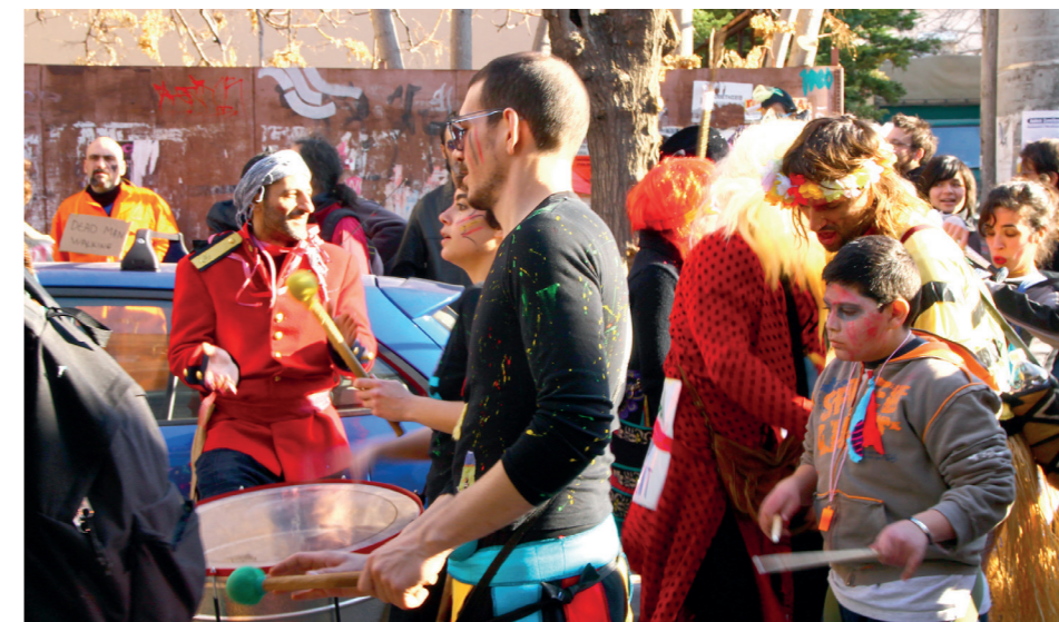
Μ. Αλεξάνδρου, ΚτΜ 2012 (πάνω) | οδός Μυκηνών, ΚτΜ 2011 (κάτω)

στην καθημερινή εμπειρία και νοηματοδότηση του Μεταξουργείου, επηρεάζοντας παράλληλα την διαδικασία συνάντησης και επικοινωνίας μεταξύ των υποκειμένων.