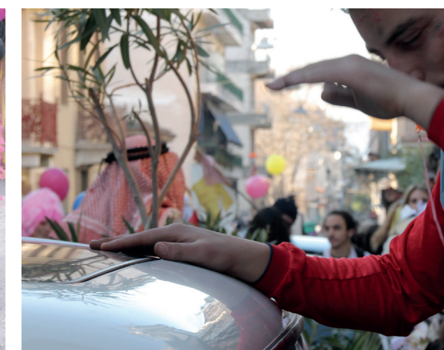
οδός Μαραθώνος, ΚτΜ 2012