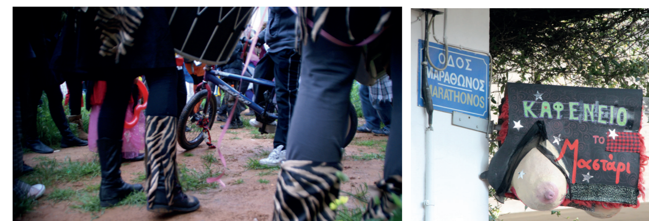
ΚτΜ 2011 (αριστερά) και 2012 (δεξιά), πηγή: Αθηνά Σταματοπούλου

δρόμους, στενά και πεζοδρόμους της, θα την εμπλουτίσει με χρώμα αλλά θα αφήσει και ένα πλήθος από σκουπίδια. Όλα τα παραπάνω συνιστούν παράγοντες μίας αισθητικής μετάλλαξης της περιοχής κατά τη διάρκεια αλλά και μετά το τέλος του ΚτΜ.