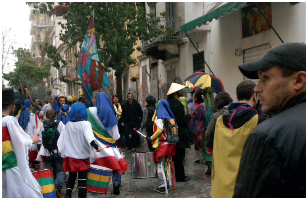
οδός Ιάσωνος, ΚτΜ 2010

Ο ήχος των κρουστών και των άλλων μουσικών οργάνων, οι φωνές και τα τραγούδια, η στενότητα χώρου που προκαλείται από την μεγάλη πληθυσμιακή πυκνότητα και η πολυχρωμία του καρναβαλικού σώματος δρουν συνολικά, ως πολλαπλά αισθητηριακά ερεθίσματα, που ενεργοποιούν μία ιδιαίτερη αντίληψη και εμπειρία του χώρου. Σύμφωνα με