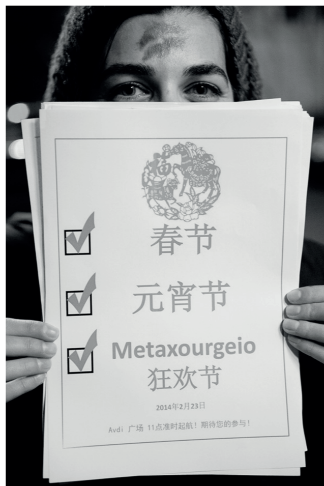
Αφίσα για το ΚτΜ μεταφρασμένη στα Κινέζικα για να κολληθεί κατά την διάρκεια της αφισκοκόλλησης στην Chinatown, Μεταξουργείο

Στα πλαίσια του καλέσματος προς τη γειτονιά, λαμβάνει χώρα η αφισκοκόλληση κειμένου που ενημερώνει για την ημερομηνία διεξαγωγής του ΚτΜ, σε παραπάνω από μία γλώσσες, ώστε να είναι κατανοητή από όλους τους κατοίκους της περιοχής. Συμπληρωματικά με την αφισκοκόλληση, διεξάγεται ο «τελάλης», το δεύτερο και τελευταίο στάδιο του καλέσματος, το οποίο συνίσταται σε μία βόλτα των μελών της διοργάνωσης στην γειτονιά, μετά μουσικής και χορού, κατά την οποία επικοινωνούν το επικείμενο καρναβαλικό γεγονός στους κατοίκους της περιοχής και στους θαμώνες των χώρων ψυχαγωγίας και εστίασης.