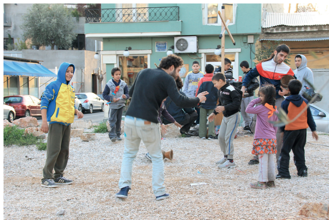
προετοιμασία - κατασκευή γαϊτανακίου στο Δημόσιο Σήμα, ΚτΜ 2012

σημεία που σε καθημερινές συνθήκες φιλοξενούν πολύ λιγότερο πληθυσμό (Δημόσιο Σήμα, πεζόδρομοι, αυλές σπιτιών μελών του ΚτΜ). Από την άλλη, την ημέρα διεξαγωγής της γιορτής παρατηρείται η συγκέντρωση μεγάλου αριθμού υποκειμένων σε διάφορα σημεία της περιοχής, μερικά από τα οποία παραμένουν σταθεροί χώροι παύσης για το ΚτΜ ανά τα χρόνια. Η επιλογή των σημείων αυτών έχει κυρίως να κάνει με την ανοιχτότητα του εκάστοτε χώρου (Δημόσιο Σήμα, οδός Μεγάλου Αλεξάνδρου, Chinatown, οδός Κεραμεικού, πλατεία Αυδή), με τις δραστηριότητες που συνδέονται με κάθε ένα από αυτά (Chinatown, Δημόσιο Σήμα, πλατεία Αυδή) αλλά και με τον μεγάλο αριθμό πολυσύχναστων κέντρων εστίασης που στεγάζονται στις γύρω περιοχές.