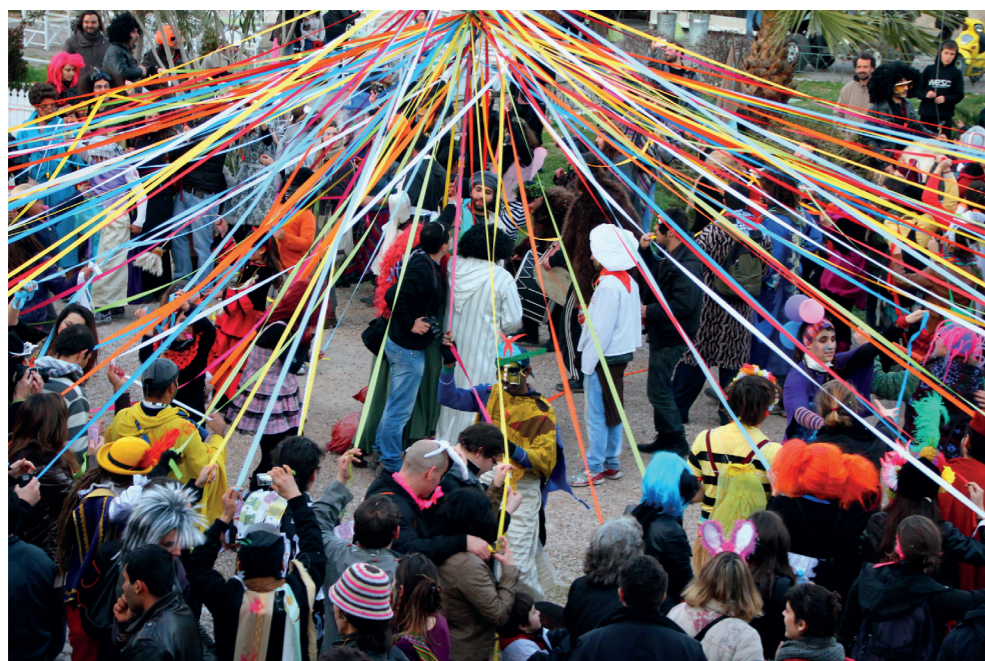
το γαϊτανάκι στην πλατεία Αυδή, ΚτΜ 2012, πηγή: Αθηνά Σταματοπούλου

Η πλατεία Αυδή, κεντρική πλατεία του Μεταξουργείου, συνιστά επίσης ένα σημείο-σταθμό για το ΚτΜ, καθώς στο χώρο της αρχίζει αλλά και τελειώνει το ΚτΜ. Ως πιο σημαντική από την έναρξη νοηματοδοτείται η λήξη του ΚτΜ η οποία περιλαμβάνει διάφορα δρώμενο όπως το κάψιμο του καρνάβαλου, το γαϊτανάκι αλλά και συναυλίες μουσικών συγκροτημάτων. Ο δημόσιος χώρος της πλατείας, νοηματοδοτείται ως τόπος συνάντησης και καθημερινής επικοινωνίας μεταξύ των υποκειμένων, ένας χώρος που κατοικείται καθημερινά από υποκείμενα που το διασχίζουν κατά την διαδρομή τους από το ένα μέρος στο άλλο ή που δραστηριοποιούνται σε αυτόν. Ως χώρος ανοιχτός επιτρέπει τη συνύπαρξη μεταξύ των υποκειμένων με ίσους όρους, χωρίς την επιβολή κριτηρίων προσβασιμότητας. Στο δημόσιο χώρο της πλατείας Αυδή, το πλήθος του ΚτΜ διαχέεται σε όλο μήκος και το πλάτος της ενώ τα δρώμενα που λαμβάνουν χώρα στα πλαίσιά του επιτρέπουν για μία ακόμη φορά την έκφραση συναισθημάτων έκστασης, ευφορίας και μέθεξης μεταξύ των υποκειμένων.