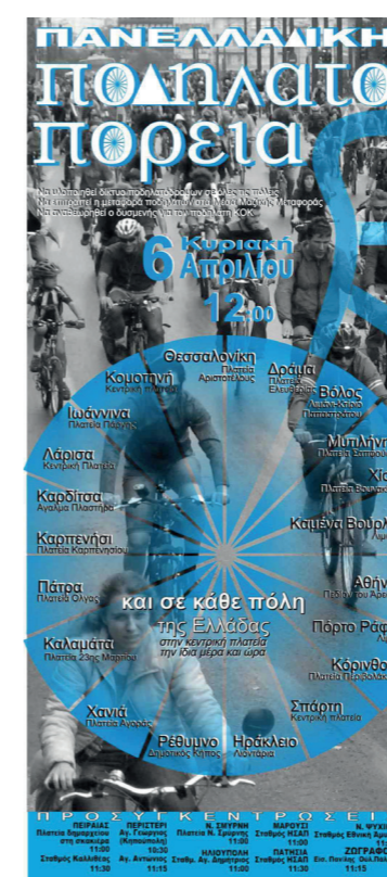
6 Απριλίου 2008 Αφίσα για την Πανελλαδική Ποδηλατοπορεία

Οι ποδηλατοπορείες «Critical Mass» (Κρίσιμη Μάζα) ξεκίνησαν το 1992 στο Σαν Φρανσίσκο των Ηνωμένων Πολιτειών της Αμερικής και μέχρι το 2003 είχαν εξαπλωθεί σε πάνω από 300 πόλεις ανά τον κόσμο [4]. Οι εκδηλώσεις αυτές ξεκίνησαν ως μια εβδομαδιαία συνάντηση κάθε Παρασκευή απόγευμα και αυτή είναι μια πρακτική που ακολούθησαν διάφορες πόλεις, ανάμεσα σε αυτές και η Αθήνα, ενώ παράλληλα διοργάνωναν και πιο μεγάλες συναντήσεις σε συγκεκριμένες ημερομηνίες κάθε χρόνο. Τα critical mass χαρακτηρίζονται, λοιπόν, από τους συμμετέχοντες ως «οργανωμένη σύμπτωση» [5], ένας όρος που περιγράφει τα βασικά χαρακτηριστικά της εκδήλωσης, η οποία είναι περισσότερο μια γιορτή ή μια αυθόρμητη συγκέντρωση παρά μια διαδήλωση.