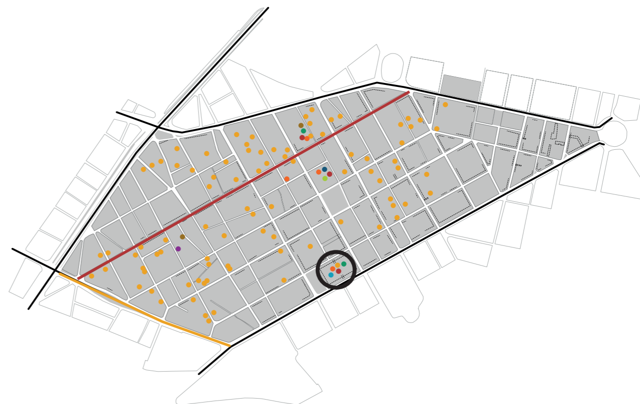
χάρτης της περιοχής μελέτης: σημειώνεται η πλατεία Αυδή (το βόρειο τμήμα της μεταξύ των οδών Μ. Αλεξάνδρου και Λεωνίδου και οι αναφορές των υποκειμένων στο σημείο αυτό (με διαφορετικά χρώματα)

Αναφερόμενη στα δρώμενα που λαμβάνουν χώρα στο τελευταίο στάδιο του ΚτΜ, προσλαμβάνει το δρώμενο του γαϊτανακίου ως μία συνθήκη που καλλιεργεί την αίσθηση της μονοτονίας και της έκστασης, μέσα από την επανάληψη του ίδιου πράγματος ενώ υποστηρίζει ότι πρόκειται για μια διαδικασία που αυξάνει την εγγύτητα των σωμάτων. Σε μία τέτοια συνθήκη η Ειρήνη θεωρεί ότι τα υποκείμενα γίνονται πιο ανοιχτά απέναντι σε κάθε είδους συνάντηση με την ετερότητα.