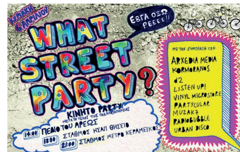
Αφίσα ενός από τα πρώτα WSP, που καλεί τον κόσμο στο πεδίο του Άρεως μετά την ποδηλατοπορεία, 6 Απριλίου 2008