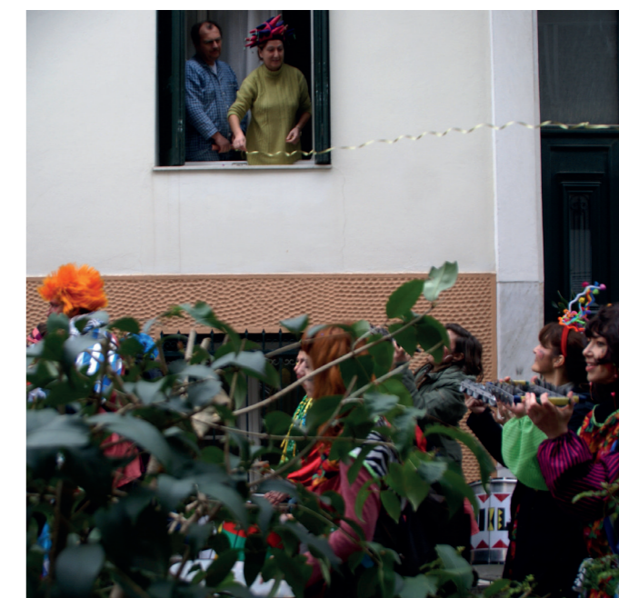
ΚτΜ 2012, πηγή: Αθηνά Σταματοπούλου