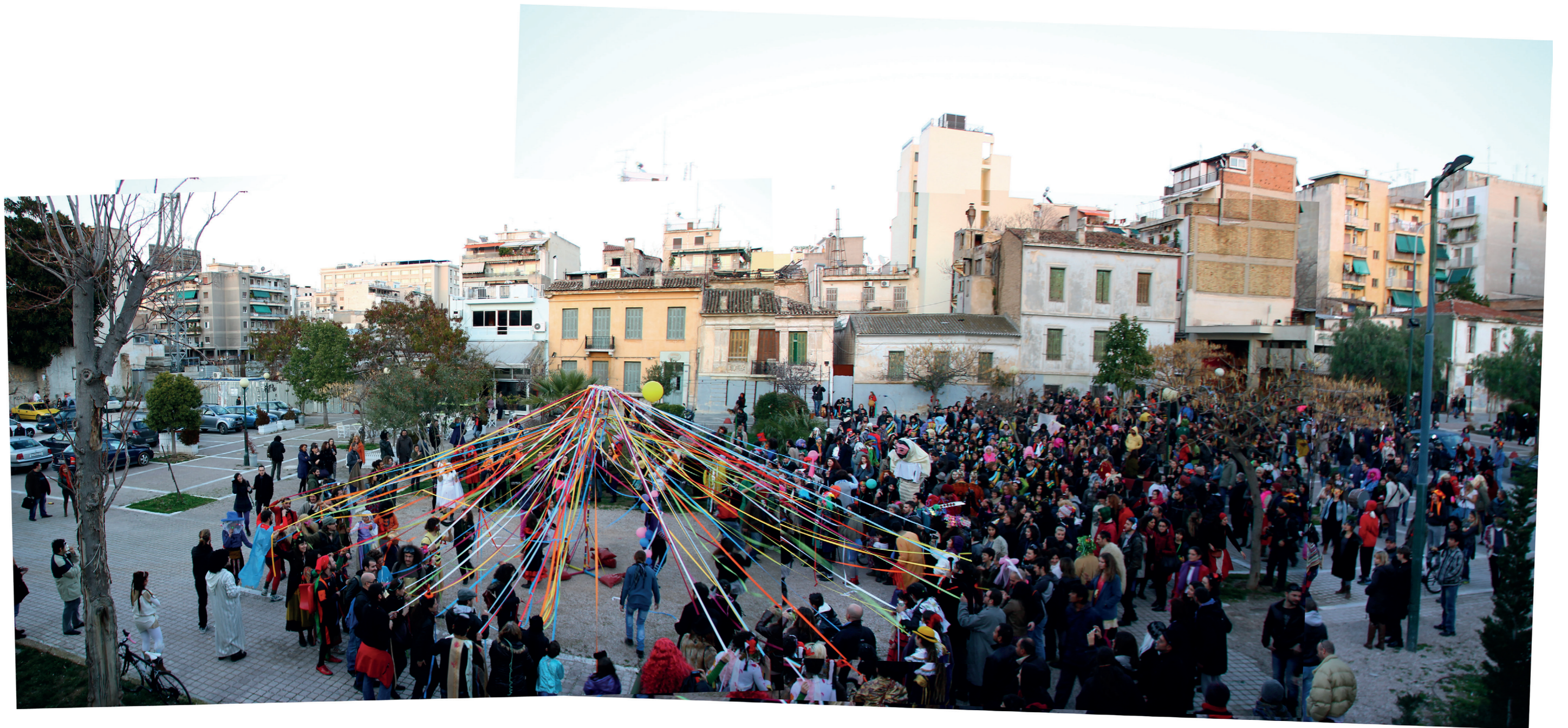
κατάληξη του ΚτΜ στην πλατεία Αυδή, 2012