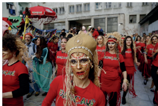
Μουσικό γκρούπ στη Chinatown, Μεταξουργείο, πηγή: http://www.cnn.gr/travel/ellada/story/24591/apokries-to-polyethniko-kar-navali-toy-metaxourgeioy

Λόγω της μορφολογίας της Κινέζικης συνοικίας, που περιορίζει το πλήθος στα συγκεκριμένα πλαίσια του υπαίθριου χώρου της και ταυτόχρονα επιτρέπει την αυξημένη εγγύτητα μεταξύ των σωμάτων, η καρναβαλική κατοίκησης της νοηματοδοτείται ως μία σειρά έντονων στιγμών στα πλαίσια των οποίων τα υποκείμενα βιώνουν συναισθήματα έκστασης και οικειότητας μεταξύ τους. Όπως είναι φυσικό, όμως, κάθε υποκείμενο προσλαμβάνει και βιώνει με διαφορετικό τρόπο τις παραπάνω συνθήκες.