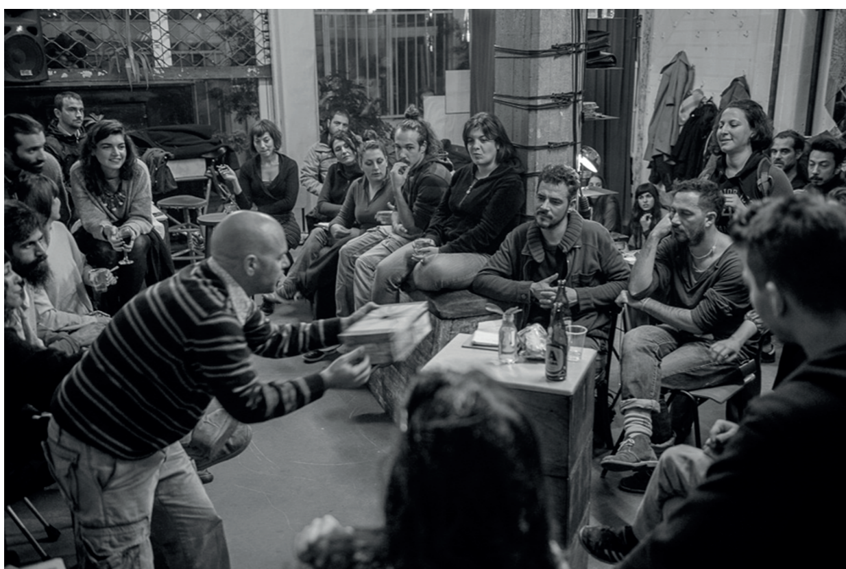
Συνέλευση στον Άνθρωπο, Μεταξουργείο

προετοιμασίας του ΚτΜ, είναι συνήθως κάτοικοι του Μεταξουργείου –ή, σε κάποιες περιπτώσεις, πρώην κάτοικοι που έχουν αναπτύξει στενές σχέσεις με την περιοχή-, οι συνελεύσεις και οι κατασκευαστικές δραστηριότητες λαμβάνουν χώρα είτε σε σπίτια μελών της ομάδας προετοιμασίας είτε σε κεντρικά σημεία –στέκια της περιοχής. Έτσι, μπορούμε να πούμε ότι το σύνολο των δραστηριοτήτων που συνιστούν το ΚτΜ ως προετοιμασία αλλά και ως δρώμενο, έχουν ως χωρικό πλαίσιο τους το Μεταξουργείο.