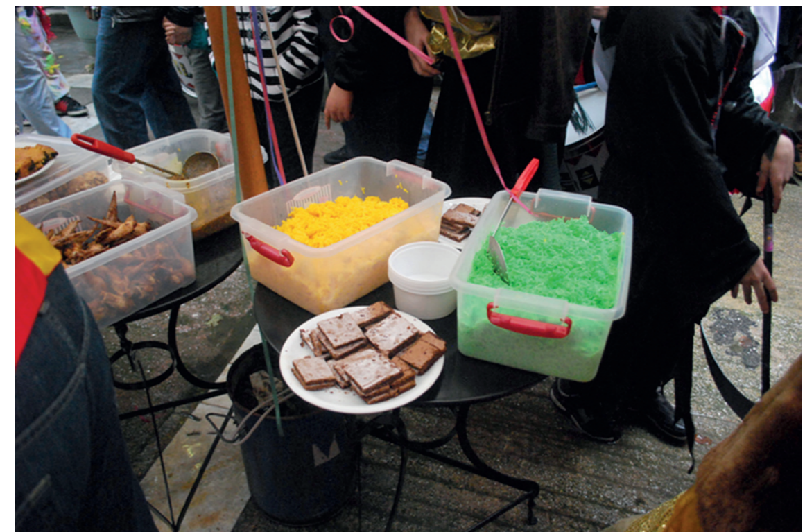
φαγητό που είχε μαγειρέψει η Ένωση Αφρικανών Γυναικών του Μεταξουργείου στην κουζίνα του μαγαζιού 'Τριφασικό' στην οδό Σφακτηρίας, ΚτΜ 2010

προσέφεραν στους καρναβαλιστές φαγητό που ήταν στο βασικό τους μενού: «...Ήταν ξεκάθαρο ότι δεν το έκαναν για διαφήμιση...ήταν πιο πολύ κάτι που γινόταν στη λογική του κεράσματος και μου άρεσε πολύ σαν στάση...ήταν σαν να συμμετέχουν και οι ιδιοκτήτες των μαγαζιών στο ΚτΜ με τον τρόπο τους...». Πιο συγκεκριμένα, της είχε κάνει εντύπωση μία οργάνωση Αφρικανών γυναικών, οι οποίες είχαν χρησιμοποιήσει την κουζίνα ενός μαγαζιού της περιοχής με σκοπό να μαγειρέψουν δικά τους φαγητά: «...Ήταν κι αυτό ένα στοιχείο συμμετοχής...μία γευστική επαφή με έναν άλλο πολιτισμό...».