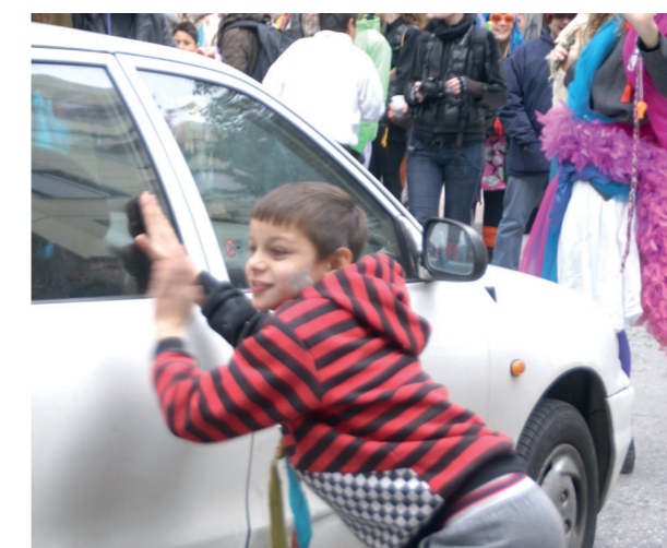
Πλαταιών και Μ. Αλεξάνδρου, ΚτΜ 2011

Επιπλέον, μία σημαντική διαφορά που παρατηρείται στην περιοχή, σε σχέση με τις καθημερινές συνθήκες, είναι η διακοπή κυκλοφορίας των αυτοκινήτων αλλά και των μαζικών μέσων μεταφοράς (κυρίως λεωφορεία) σε ορισμένους δρόμους από τους οποίους περνάει το ΚτΜ. Αυτό έχει ως αποτέλεσμα, όπως προείπαμε, την καλλιέργεια νέων τρόπων μετακίνησης και κινησιολογίας στον δημόσιο χώρο, έναν χώρο που σε καθημερινές συνθήκες κυριαρχείται από κινούμενα μέσα και όχι από πεζούς.