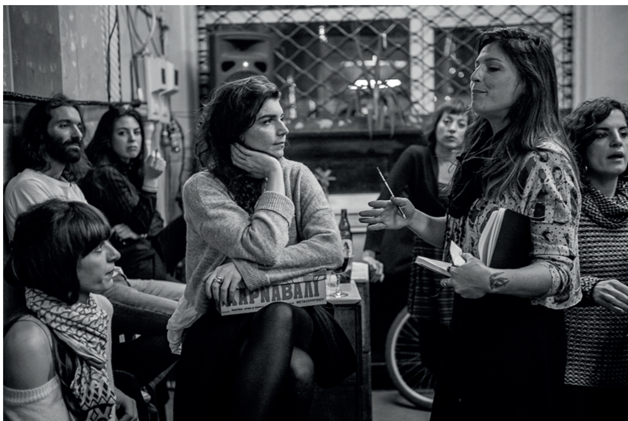
Συνέλευση στον Άνθρωπο, Μεταξουργείο, πηγή: Αλέξανδρος Μανόπουλος