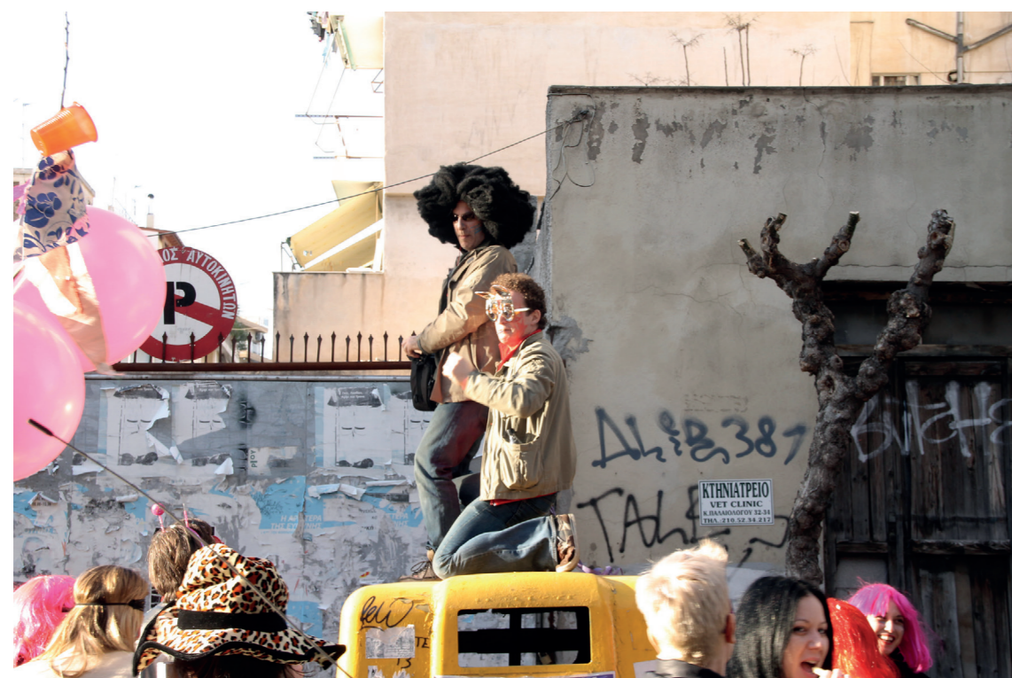
ΚτΜ 2012

Σε αυτό το πλαίσιο, το ΚτΜ, ως μία διαφορετική, σε σχέση με την καθημερινή, κατοίκηση του δημόσιου χώρου, δύναται ενεργοποιήσει νέους τρόπους αντίληψης και εμπειρίας του χώρου, του χρόνου και των άλλων υποκειμένων, εκ μέρους του υποκειμένου που συμμετέχει σε αυτό. Ίσως η πιο εμφανής αλλαγή που συντελείται στην περιοχή κατά την διάρκεια του ΚτΜ, να είναι η προσωρινή μεταμπίηση του ίδιου του χώρου: οι πολύχρωμες μεταμφιέσεις και τα καρναβαλικά άρματα προσδίδουν μία ιδιαίτερη πολυχρωμία που δεν μπορεί να περάσει απαρατήρητη από τα υποκείμενα που συμμετέχουν στο ΚτΜ αλλά και από τους απλούς περαστικούς ή κατοίκους της περιοχής. Το ΚτΜ, στο πέρασμά του από τους διάφορους