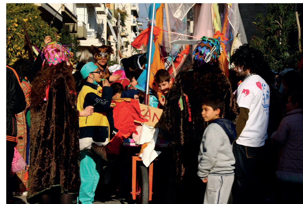
Μ. Αλεξάνδρου, ΚτΜ 2012

γειτονιά του Μεταξουργείου πλημμυρίζεται από ένα μεγάλο πλήθος υποκειμένων τα οποία κατοικούν τους δρόμους και τις γωνιές του είτε ως μέρος της καρναβαλικής πορείας στο χώρο είτε περιφερειακά αυτής, σχηματίζοντας μικρές ενότητες πλήθους σε διαφορετικά κάθε φορά σημεία του. Αν και το ακριβές μέγεθος του πλήθους μεταβάλλεται ανά έτος, η μεταβολή της πληθυσμιακής πυκνότητας της περιοχής είναι σημαντικά αισθητή κάθε χρονιά. Το Μεταξουργείο, το οποίο συνιστά, σε καθημερινά πλαίσια, κατά κύριο λόγο προορισμό ψυχαγωγίας και συνάντησης με άλλα υποκείμενα, νοσηματοδοτείται ως σχετικά ήσυχη γειτονιά, ειδικά της πρωινές ώρες, που όμως ζωντανεύει αρκετά τα βράδια. Η ύπαρξη πολλών κέντρων εστίασης έχει ως αποτέλεσμα τη συγκέντρωση ενός μεγάλου αριθμού υποκειμένων σε αυτά ενώ η κατοίκηση στο δημόσιο χώρο της περιοχής έχει ως κεντρικό σκοπό την μετακίνηση από και προς τα κέντρα αυτά.