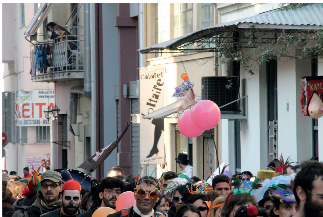
οδός Μαραθώνος, ΚτΜ 2012

Ένα από τα πιο προφανή υλικά αποτελέσματα του ΚτΜ είναι η μεταβολή της πληθυσμιακής πυκνότητας του χώρου κατά την διάρκεια της καρναβαλικής γιορτής σε σχέση με αυτήν που παρατηρείται σε καθημερινές συνθήκες στην περιοχή. Την ημέρα διεξαγωγής του ΚτΜ, η