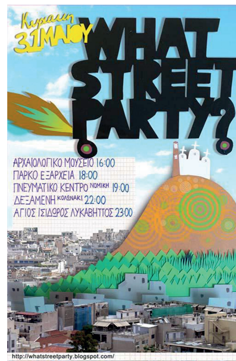
Αφίσα άλλου WSP