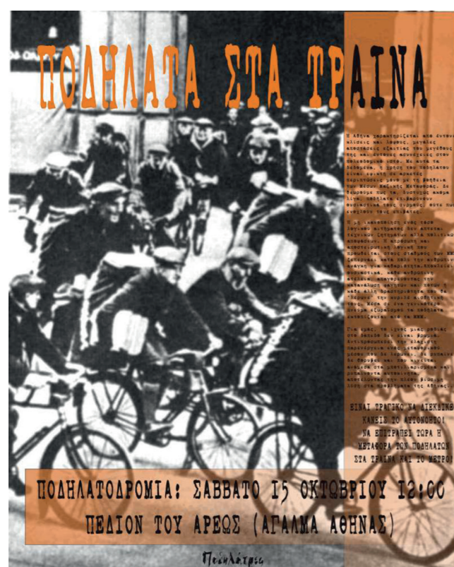
Αφίσα της πρώτης ποδηλατοπορείας στην Αθήνα τον Οκτώβριο του 2005, τότε αναφέρονταν ακόμα σε αυτές ως 'ποδηλατοδρομίες'

με τα Μέσα Μαζικής Μεταφοράς. Ωστόσο, στη συνέχεια αναπτύχθηκε σε ένα πανελλαδικό κίνημα πολύμορφης δράσης υποστήριξης του ποδηλάτου ως ενός εναλλακτικού μέσου μεταφοράς στο αστικό περιβάλλον, που εκτός από τις Ποδηλατοπορείες στο κέντρο της Αθήνας και άλλων ελληνικών πόλεων, περιλάμβανε ημερίδες, διαλέξεις, ομιλίες και μαθήματα, παράλληλες δράσεις για κοινωνικά και πολιτικά θέματα, παιχνίδια στο αστικό περιβάλλον και συνεργασίες με άλλες συλλογικότητες που δραστηριοποιούνται στην πόλη [3]. Αν και όταν ξεκίνησε το συγκεκριμένο κίνημα θα μπορούσε να χαρακτηριστεί ακόμα και πρωτοποριακό για το ελληνικό πλαίσιο, ιδιαίτερα αν αναλογιστούμε την κεντρική και κυρίαρχη θέση του αυτοκινήτου στο αστικό περιβάλλον, αυτό δεν σημαίνει πως είναι ένα κίνημα που πρώτο-εμφανίστηκε εδώ. Οι ελληνικές Ποδηλατοπορείες μπορούν να ιδωθούν ως η ελληνική εκδοχή ενός παγκόσμιου κινήματος υπέρ των ποδηλάτων στις πόλεις, που ξεκίνησε από την βόρεια Αμερική τη δεκαετία του 1990.