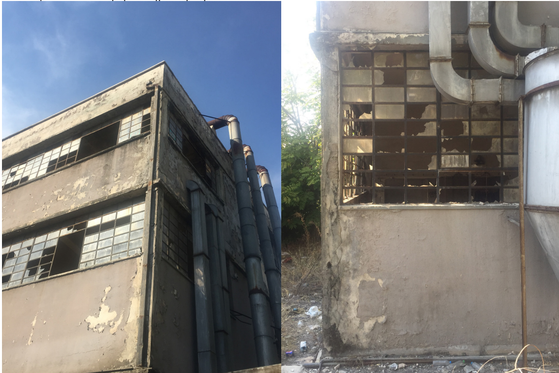
Εικ.7, 8: Βιομηχανικό Ερείπιο στην Αχαρνών

Ηδη, οι βιομηχανικές πόλεις του εξωτερικού, από τις οποίες θα παρουσιαστούν κάποια χαρακτηριστικά παραδείγματα, κινούνται προς αυτήν την κατεύθυνση. Αν και με κάποια καθυστέρηση και, ίσως, σε μικρότερη ένταση, καθώς δεν υπάρχει βαριά βιομηχανία, η αποβιομηχάνιση και οι συνέπειές της γίνεται μια κατάσταση που, με την πάροδο των χρόνων, εμφανίζεται όλο και πιο έντονα και στην Ελλάδα, κυρίως σε πόλεις που η οικονομία τους βασιζόταν στη βιομηχανία. Ανάμεσα σ’ αυτές είναι και η Δραπετσώνα, όπου το εργοστάσιο λιπασμάτων είχε συνδεθεί στενά με τη ζωή στην πόλη. Σε ολόκληρη τη χώρα, εγκαταλελειμμένα εργοστάσια αφήνονται στη φυσική τους φθορά ή μετατρέπονται σε χώρους που θα στεγάσουν άλλες δραστηριότητες.