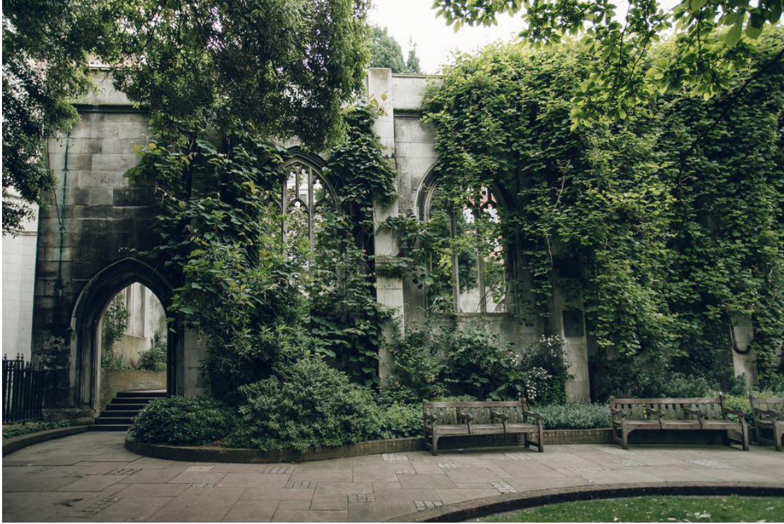
Εικ.4.5: Ρομαιοκαθολική εκκλησία στο Λονδίνο St Dunstan in the East