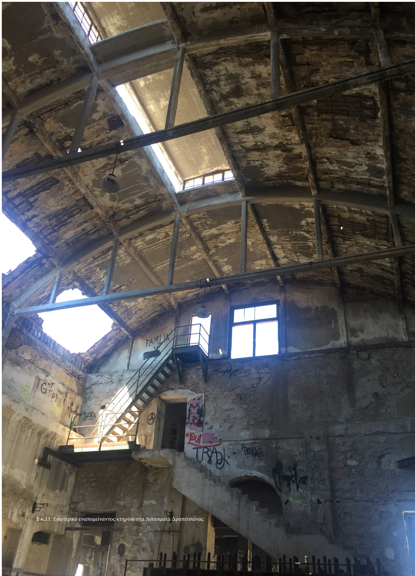
Εικ.11: Εσωτερικό εναπομείναντος κτηρίου στα Λιπάσματα Δραπετσώνας