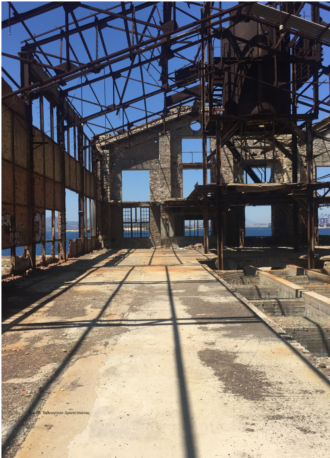
Εικ.10: Υαλουργείο Δραπετσώνας