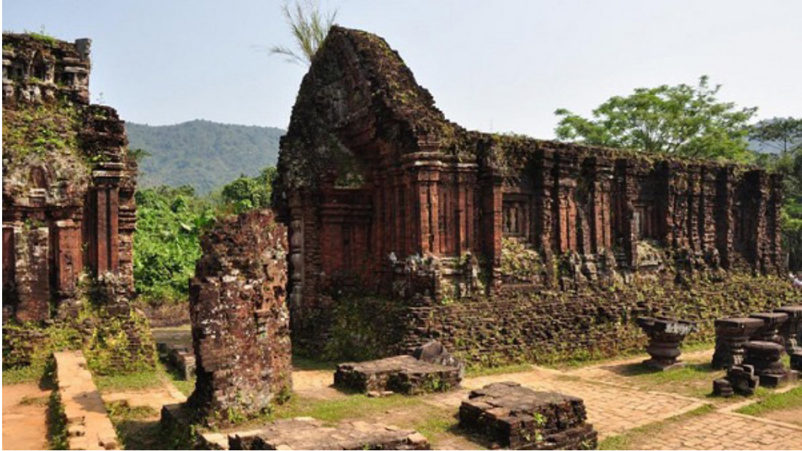
Εικ.3: Αρχαιολογικός χώρος Μι Σον, Βιετνάμ, Μνημείο Παγκόσμιας Πολιτιστικής Κληρονομιάς UNESCO