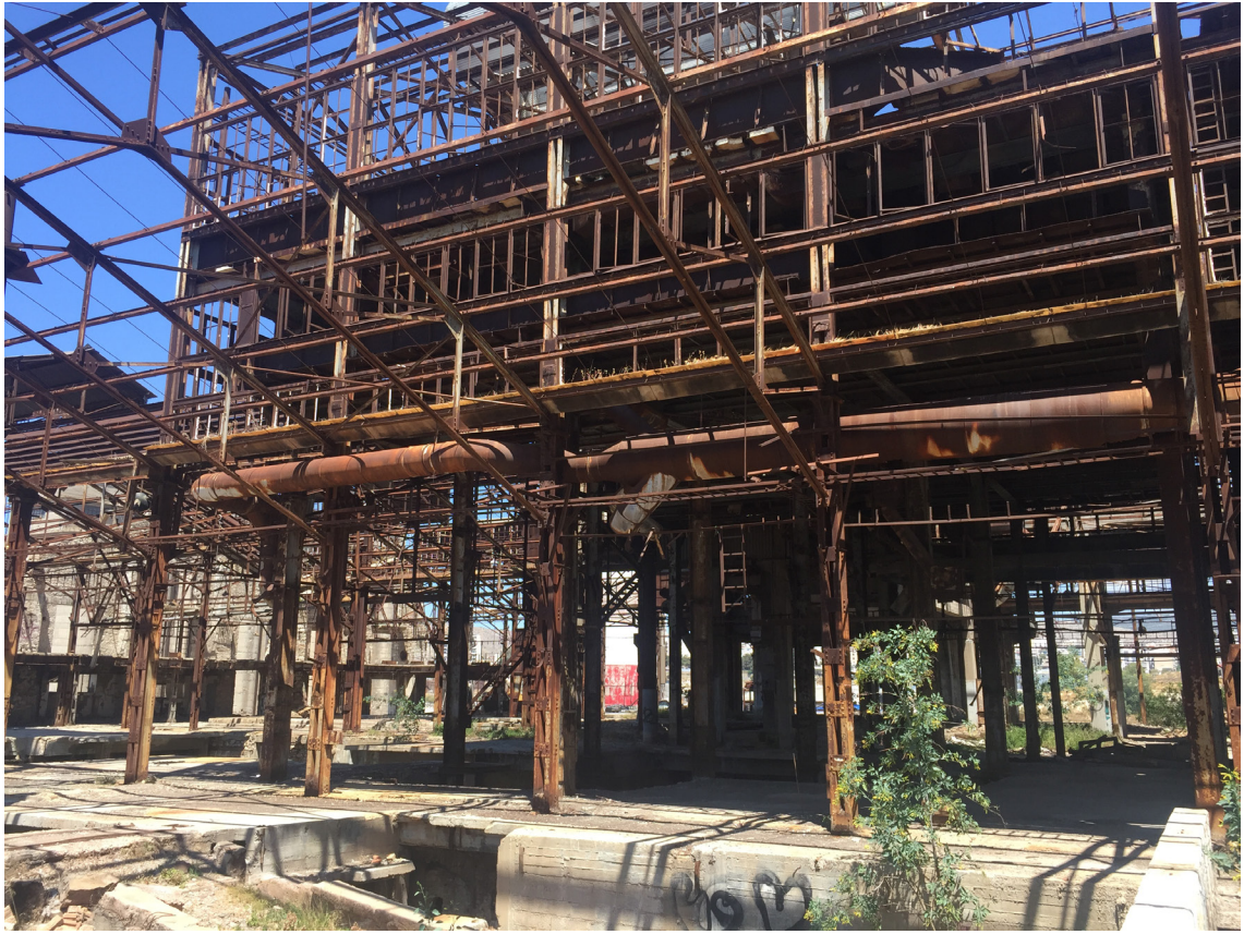
Εικ.2: Υαλουργείο Δραπετσώνας