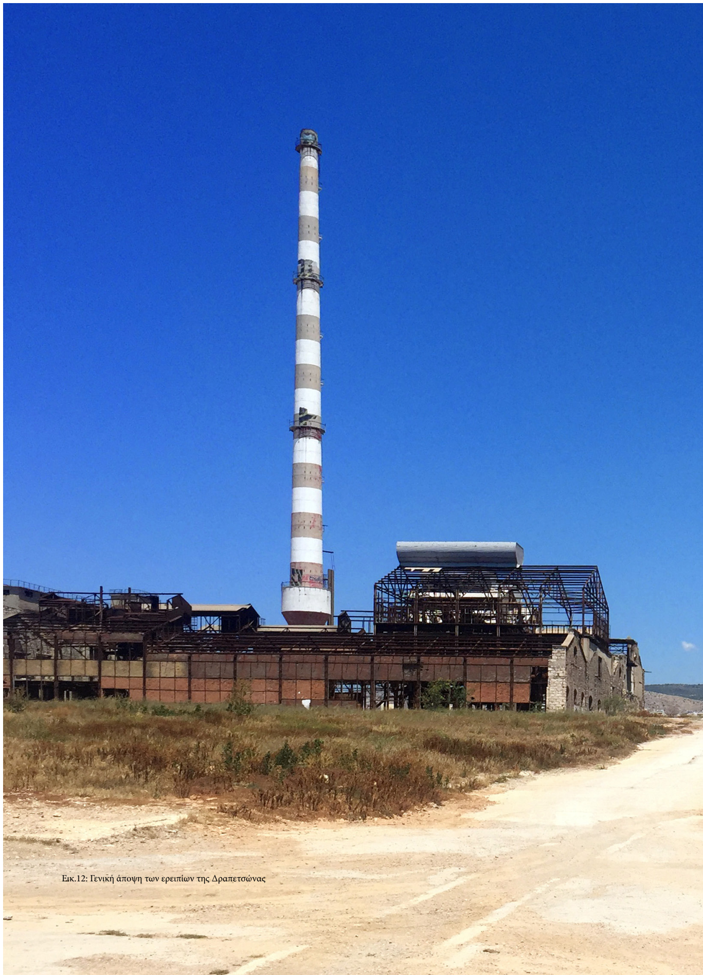
Εικ.12: Γενική άποψη των ερειπίων της Δραπετσώνας