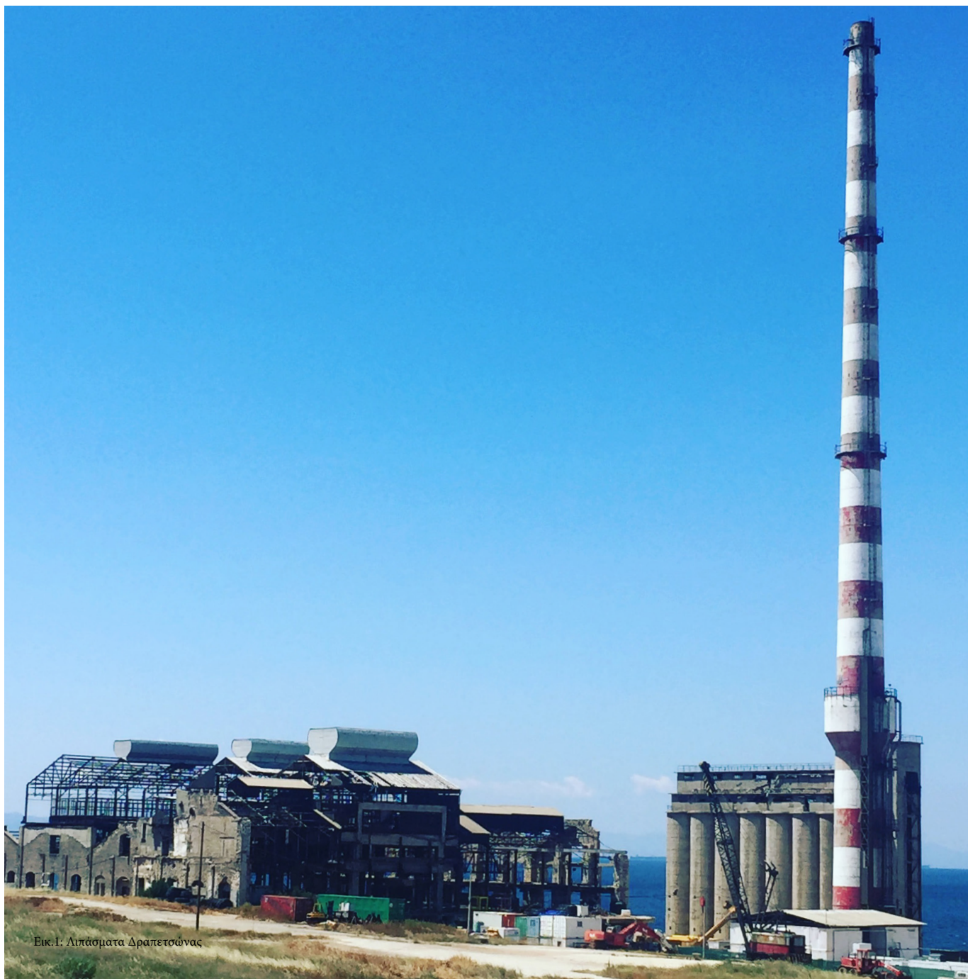
Εικ. 1: Λιβάσματα Δραπέτσωνας