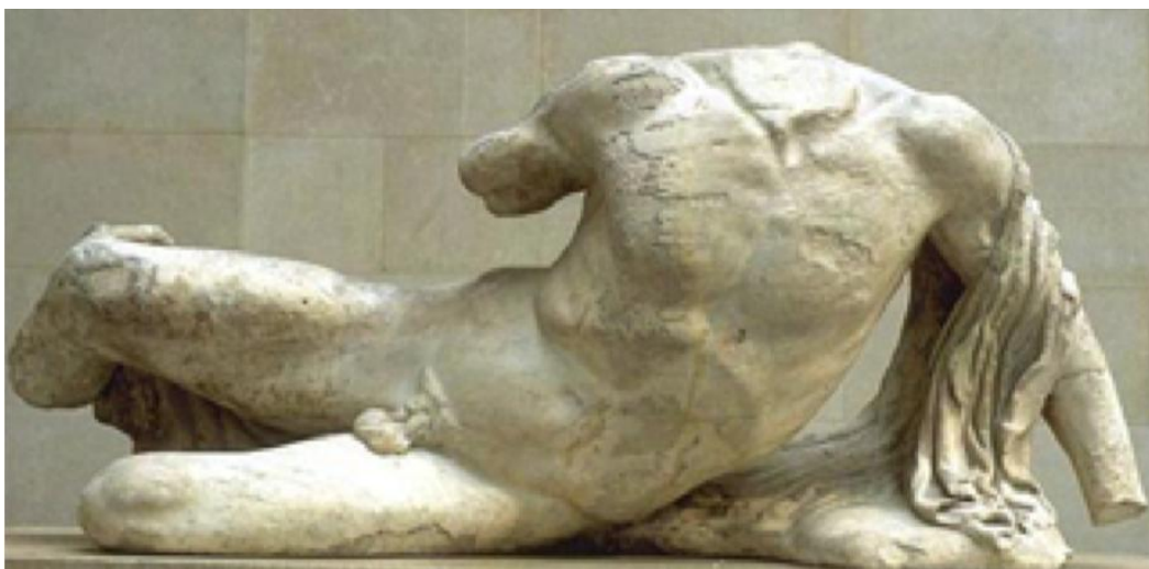
Ο Θεός-ποταμός Κηφισός, ζωοφόρος του Παρθενώνα, γλυπτό στο δυτικό αέτωμα

και την ατμοσφαιρική ρύπανση της περιοχής. Κατά τη διάρκεια πρόσφατων υδραυλικών έργων στον Κηφισό, αποκαλύφθηκαν τμήματα των Μακρών Τειχών. Αυτά τα τείχη συνέδεαν την αρχαία πόλη των Αθηνών με την πόλη του Πειραιά σε περίπτωση έντονων πλημμυρών.