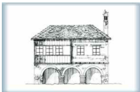
Εικόνα 15: Ζαγορίσιο σπίτι 38

Το Ζαγορίσιο σπίτι έχει αμυντικό χαρακτήρα για τις δυσμενείς καιρικές συνθήκες και τις επιδρομές - ληστείες. Είναι κυρίως διώροφο ή τριώροφο, με σχήμα απλό χωρίς ιδιαίτερη διακόσμηση στις εξωτερικές επιφάνειες. Οι πέτρες της στέγης έχουν την ίδια υφή και χρώμα με αυτές της τοιχοποιίας. 37