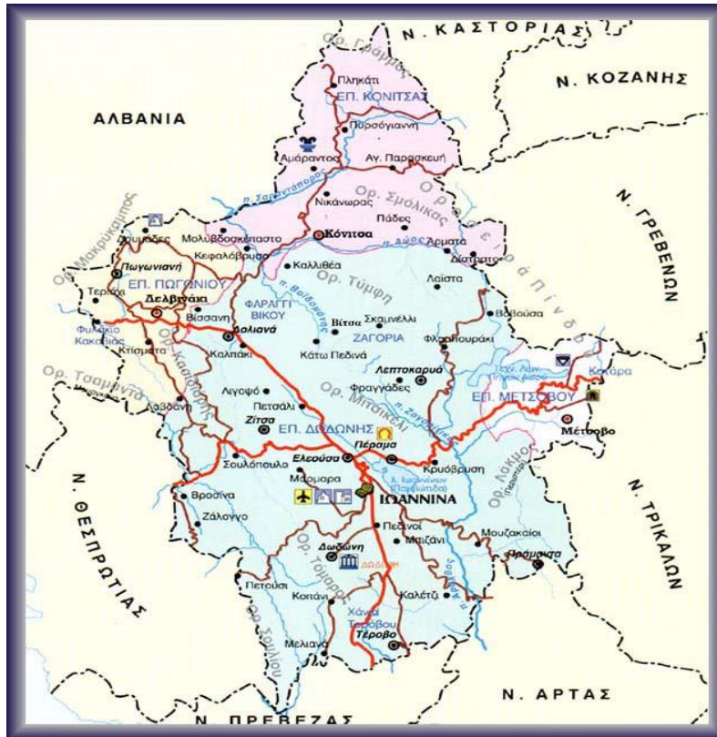
Εικόνα 1: Χάρτης Ν. Ιωαννίνων και η περιοχή του Ζαγορίου 4