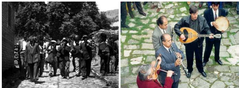
Εικόνες 20,21: Πανηγύρια στο Ζαγόρι 51

Σήμερα το πανηγύρι συγκεντρώνει πλήθος κόσμου κάθε χρόνο, εξακολουθεί να διατηρεί το παραδοσιακό του "χρώμα" και οι επισκέπτες έχουν την ευκαιρία να απολαύσουν παραδοσιακή μουσική.