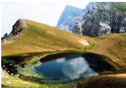
Εικόνα 6: Δρακόλιμνη 13

Ο ορεινός όγκος της Τύμφης βρίσκεται μεταξύ του ποταμού Αώου και τον παραπόταμου του Βοϊδομάτη στη προστατευόμενη περιοχή Βόρειας Πίνδου. Οι κορυφές της Τύμφης οι πιο ψηλές από δυτικά προς ανατολικά είναι: Αστράκα (2436 μ.), Λάπατος (2251 μ.), Πλόσκος (2388 μ.), Γκαμήλα (2497 μ.), Καρτερός (2251 μ.), Μεγάλα Λιθάρια (2467 μ.), Γκούρα,(2466 μ.), Τσούκα-Ρόσια(2380 μ.), Τζουμάκο (2157 μ.) τέλος απέναντι, στην περιοχή της Κόνιτσας βρίσκεται ο Σμόλικας(2637 μ.) η πιο ψηλή κορυφή της Πίνδου. Σε ένα οροπέδιο του συγκροτήματος του ορεινού όγκου της Τύμφης βρίσκεται η Δρακόλιμνη σε υψόμετρο 2050 μ. Η δρακόλιμνη της Τύμφης είναι μια αλπική λίμνη η οποία οφείλει την ύπαρξη της στους παγετώνες που υπήρχαν στη περιοχή πριν από 10000 χρόνια και συνεχίζει να «τροφοδοτείται» από τα χιόνια που πέφτουν στην περιοχή. Πήρε το όνομα της από τους Τρίτωνες (σπάνιο είδος αμφίβιας σαύρας) που ζουν στα νερά της και μοιάζουν με μικρά δρακάκια.