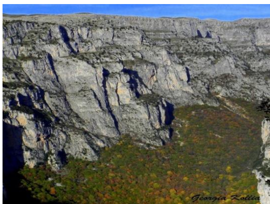
Εικόνα 7: Φαράγγι του Βίκου 14

Βοϊδομάτη στο Πάπιγκο, με μήκος 12χλμ. και μέγιστο ύψος 1000μ. Το ποτάμι που διασχίζει το φαράγγι είναι ο Βοϊδομάτης. Το πλάτος της χαράδρας κυμαίνεται από 30 μέχρι 100 μέτρα και οι πλαγιές του είναι κατάφυτες από σπάνια λουλούδια και βότανα. Τα βότανα του Βίκου έχουν θεραπευτικές ιδιότητες και γι αυτό τα παλιά χρόνια αναπτύχθηκε η πρακτική ιατρική με τους Βικογιατρούς. Το φαράγγι περνάει εκτός των άλλων και από τα χωριά Κουκούλι, Καπέσοβο και Βραδέτο, είναι τμήμα του Δρυμού Βίκου - Αώου ο οποίος με 126.000 στρέμματα είναι ο μεγαλύτερος Δρυμός της χώρας (Εθνικός Δρυμός Βίκου - Αώου).