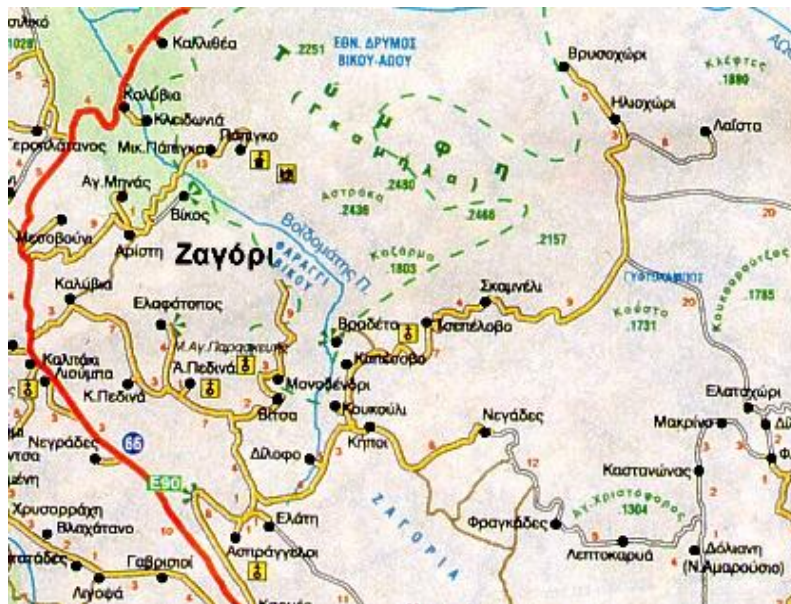
Εικόνα 2: Τα χωριά του Ζαγορίου και η πρόσβαση από τα Ιωάννινα 5