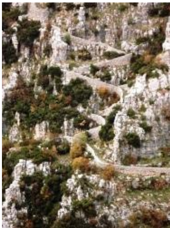
Εικόνα 14: Η Σκάλα του Βραδέτου

• Η Σκάλα του Βραδέτου: Η σκάλα του Βραδέτου μέχρι το 1973 αποτελούσε τον μοναδικό δρόμο πρόσβασης για το χωριό Βραδέτο, πλέον αποτελεί δημοφιλή τουριστικό προορισμό καθώς και ορειβατικό μονοπάτι .