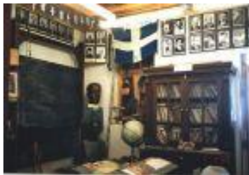
Εικόνα 22: Λαογραφικό Μουσείο Ελαφοτόπου 54

Η όλη προσπάθεια άρχισε το 1978 με πρωτοβουλία του Ελαφοτοπίτη Εκπαιδευτικού Τέχνης και Γλύπτη Μιχαήλ Ματθ. Οικονομίδη. Το μουσειακό υλικό προέρχεται από δωρεές και αγορές.