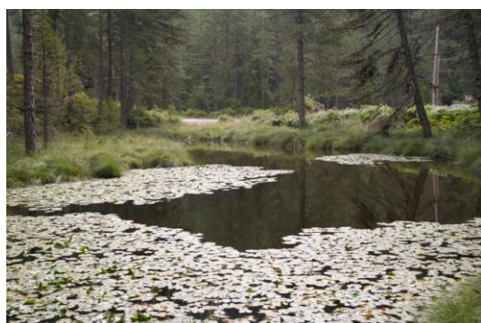
Εικόνα 8: Μικρολίμνη με νούφαρα 16

Έχει διάσπαρτες μικρολίμνες στην Ανατολική πλευρά του Φλαμπουραρίου (Τσούκα Ρόσσιας) και στο οροπέδιο ΒΑ του Φλαμπουραρίου στα σύνορα με το νομό Γρεβενών (στο οροπέδιο της οροσειράς Αυτιά Φλέγκα). Ιδιαίτερου φυσικού κάλλους είναι η μικρολίμνη με νούφαρα που βρίσκεται Βόρεια του Γρεβενιτίου δίπλα στο ρέμα Ζουρίκα μοναδική στην Περιφέρεια Ηπείρου για την σπάνια χλωρίδα. Στην περιοχή ανήκει και τμήμα της Τεχνητής Λίμνης Πηγών Αώου που διακρίνεται για τα καθαρά νερά της, τη φυσική ομορφιά, τους πολλούς και μικρούς κολπίσκους με ενάλιο πλούτο από πέστροφες, караβίδες και διάφορα άλλα είδη ψαριών των οποίων επιτρέπεται η ερασιτεχνική αλιεία.