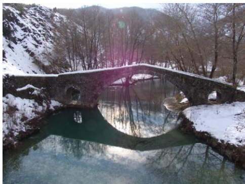
Εικόνα 16: Γέφυρα Καμπέρ-Αγά 42

• Γέφυρα Καμπέρ-Αγά: Χτισμένη με πέτρα πάνω στον Ζαγορίτικο ποταμό (παραπόταμο του Αράχθου) αποτελεί δείγμα αρχιτεκτονικής των μαστόρων του τόπου και δίνει τη δυνατότητα στον επισκέπτη να γνωρίσει την παράδοση και τον πολιτισμό μιας άλλης εποχής.