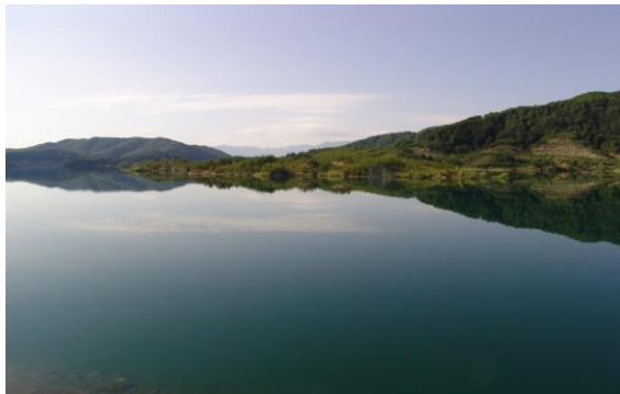
Εικόνα 9: Λίμνη Πηγών Αώου 17