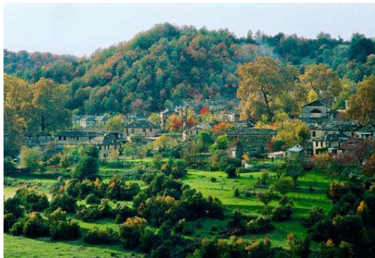
Εικόνα 5: Κοινότητα Παπίγκου 11

Το ίδιο πλούσια παρουσιάζεται και η πανίδα της περιοχής. Σημαντικό είναι ότι σχεδόν όλα τα σπάνια πουλιά και θηλαστικά του ορεινού χώρου, που κινδυνεύουν να εξαφανιστούν, βρίσκονται στο δρυμό γύρω από το Πάπιγκο. Υπολογίζεται πως στην ευρύτερη περιοχή ζουν 133 είδη πουλιών, 24 είδη θηλαστικών, 10 είδη αμφιβίων και 21 είδη ερπετών.