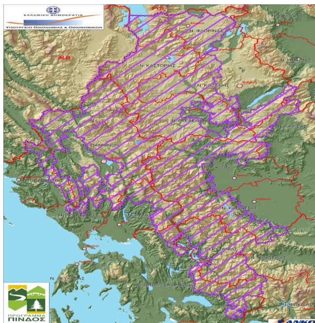
Εικόνα 26: Χάρτης Περιοχής Εφαρμογής του Προγράμματος «Πίνδος» 78

Η περιοχή του προγράμματος «Πίνδος» καταλαμβάνει το μεγαλύτερο τμήμα του κεντρικού κορμού της Ελλάδας με άξονα αναφοράς την οροσειρά της Πίνδου. Έχει συνολική έκταση 18.436 χλμ. 2 και καλύπτει τα ορεινά τμήματα πέντε Περιφερειών. Η περιοχή χαρακτηρίζεται από έντονο ανάγλυφο, συχνά με απότομες πλαγιές. Το 70% περίπου των οικισμών βρίσκονται σε υψόμετρα μεταξύ 500 και 1.400 μ.