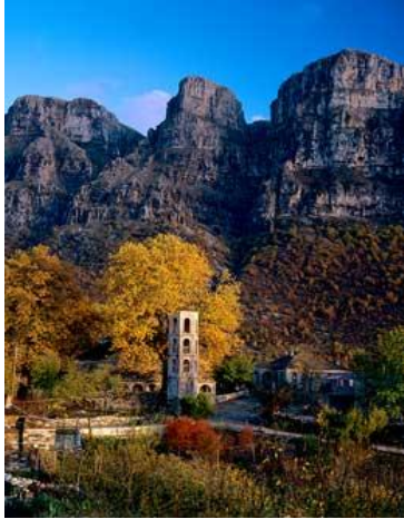
Εικόνα 13: Πύργοι Παπίγκου 32

• Η Σκάλα του Βραδέτου: Η σκάλα του Βραδέτου μέχρι το 1973 αποτελούσε τον μοναδικό δρόμο πρόσβασης για το χωριό Βραδέτο, πλέον αποτελεί δημοφιλή τουριστικό προορισμό καθώς και ορειβατικό μονοπάτι .