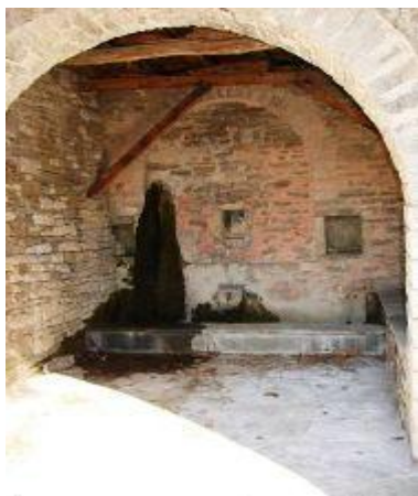
Εικόνα 19: Ζαγορίσια Βρύση 46