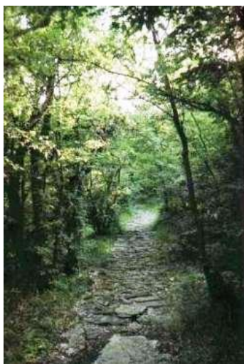
Εικόνα 10: Μονοπάτι ορειβατικής διαδρομής 30