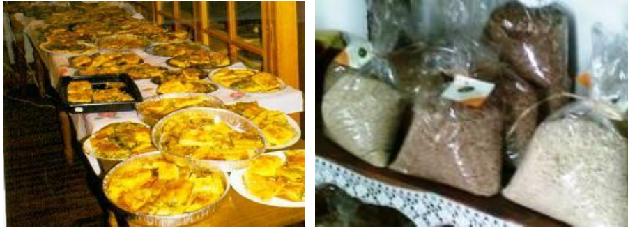
Εικόνες 11,12: Παραδοσιακά τοπικά προϊόντα Ζαγορίου