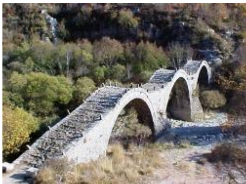
Εικόνα 18: Τρίτοξο γεφύρι