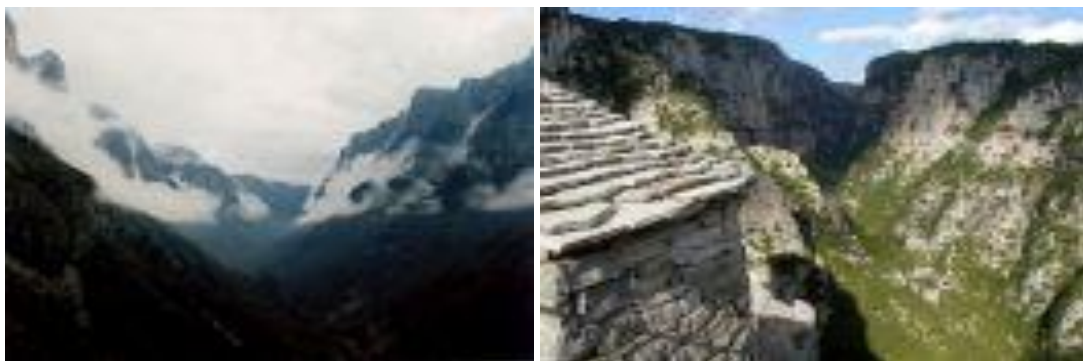
Εικόνες 3 και 4: Εθνικός Δρυμός Βίκου - Αώου 8

Υπάρχουν τρία φαράγγια: του Βίκου μήκους δώδεκα χιλιομέτρων που σε μερικά σημεία το κάθετο ύψος του φτάνει τα 900 μέτρα τοποθετώντας το στα βαθύτερα του κόσμου, το φαράγγι του Βικάκι και η χαράδρα του Αώου, που βρίσκεται μεταξύ των βουνών Τραπεζίτσα και Γκαμήλα, μήκους δέκα χιλιομέτρων.