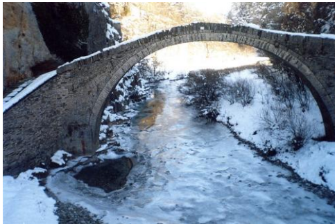
Εικόνα 17: Γεφύρι του Κόκκορου ή Νούτσου

στρατιωτικό απόσπασμα. Ο Νταβέλης απέδωσε τη σωτηρία του στην Αγία Παρασκευή, επειδή κοντά στο γεφύρι βρίσκεται ένα ξωκλήσι της Αγίας Παρασκευής. Για το λόγο αυτό, ο ληστής κατασκεύασε το εικόνισμα μέσα στη μικρή σπηλιά. Τα δεύτερο όνομα του γεφυριού προέρχεται από το επώνυμο του κατόχου του παρακείμενου μύλου. Ο μύλος αυτός εξυπηρετούσε τις ανάγκες των κατοίκων του Κουκουλίου, του Καπεσόβου, του Βραδέτου, του Διλόφου και των Ασπραγγέλων.