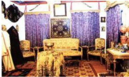
Εικόνα 23: Λαογραφικό μουσείο «Αγάπιος Τόλης»

• Λαογραφικό μουσείο «Αγάπιος Τόλης»: Βρίσκεται στους Κήπους στο οποίο υπάρχει σημαντική συλλογή σκευών και εργαλείων της παραδοσιακής ζωής του Ζαγορίου.