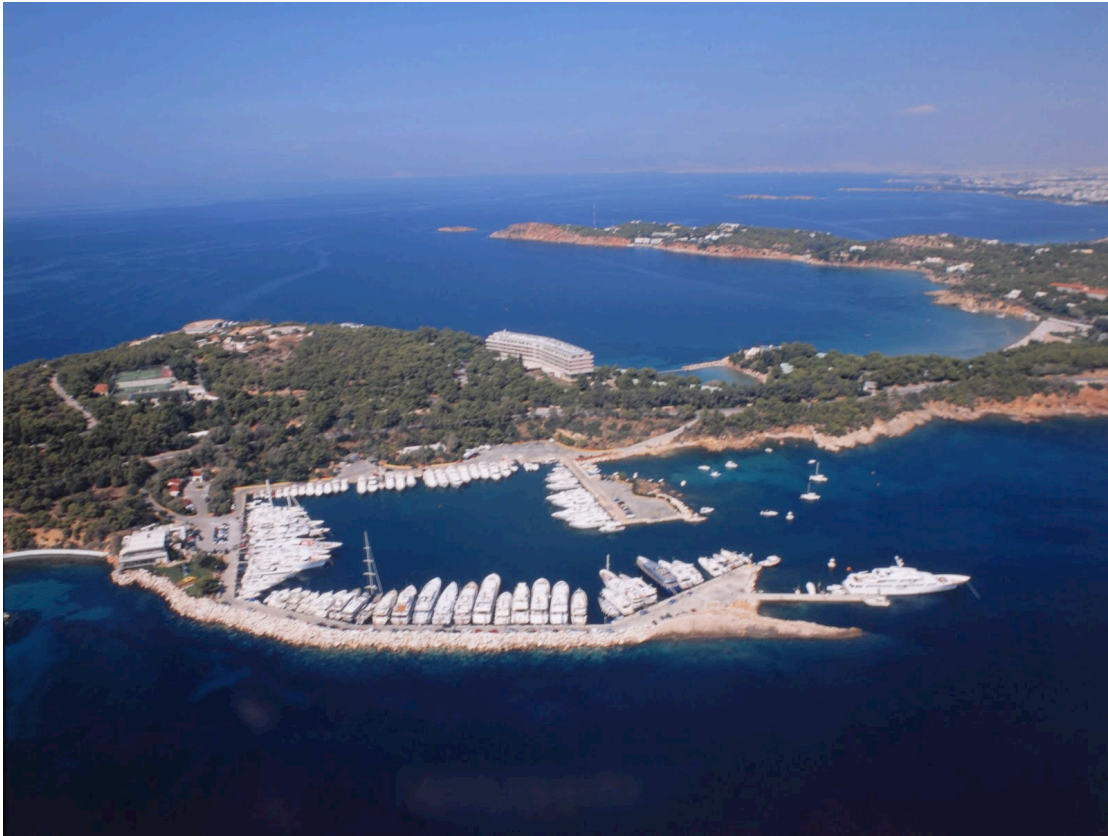
Εικόνα 7. Μαρίνα Βουλιαγμένης.

Στο παραλία του πρώην δήμου Βουλιαγμένης εκτός από τις ξενοδοχειακές εγκαταστάσεις, υπάρχει η μαρίνα Βουλιαγμένης, Η παραλία λουομένων της εταιρείας Ελληνικά Τουριστικά Ακίνητα και ο ναυτικός όμιλος Βουλιαγμένης. Τέλος οι εκτάσεις της Πολεμικής Αεροπορίας.