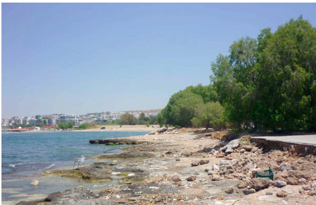
Εικόνα 11. Κομμάτι παραλίας του δήμου Ελληνικού.

Συγκεκριμένα ο δήμαρχος δήλωσε: «εκφράζοντας όχι μόνο τη θέληση των δημοτών μας, αλλά και το ζωτικό συμφέρον όλων των κατοίκων του λεκανοπεδίου, παραμένουμε σταθεροί στην τεκμηριωμένη θέση μας να γίνει ο χώρος μητροπολιτικό πάρκο υψηλού πρασίνου με ήπιες πολιτιστικές, αθλητικές και άλλες κοινωφελείς χρήσεις. Επιβεβαιώνουμε την πρόθεση μας να αντισταθούμε σε κάθε προσπάθεια που θα αναιρεί τη μετατροπή του Ελληνικού σε πάρκο και θα το μετατρέψει σε χώρο κερδοσκοπίας επιχειρηματικών συμφερόντων σε βάρος της ζωής μας, της υγείας μας και των μελλοντικών γενιών».