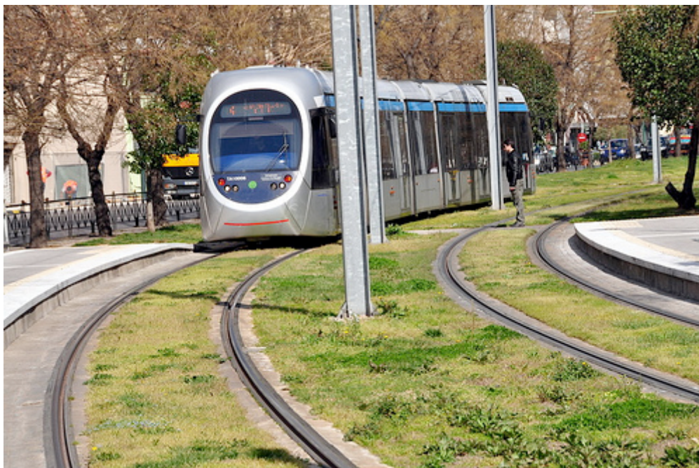
Εικόνα 8. Έλλειψη διαβάσεων κατά μήκος των γραμμών του τραμ.

Εκτός από τον οικονομικό περιορισμό, οι πολίτες αντιμετωπίζουν και τον χωρικό περιορισμό, όπως διαφαίνεται από τις απαντήσεις τους.