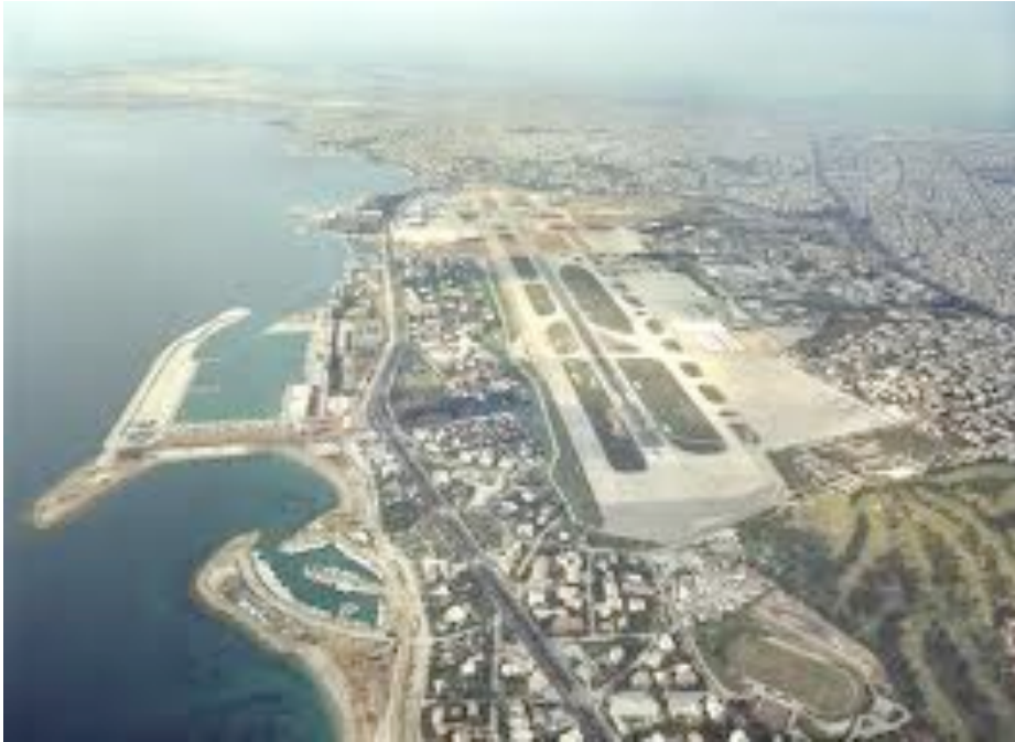
Εικόνα 6. Πανοραμική άποψη του δήμου Ελληνικού.

Τα υπόλοιπα 5.500 στρέμματα του δήμου δεν είναι άλλα από τις εγκαταστάσεις του πρώην αερολιμένα και των Ολυμπιακών ακινήτων, καθώς και οι εγκαταστάσεις της 129 Πτέρυγας Υποστήριξης της Ελληνικής Πολεμικής Αεροπορίας και της πρώην Αμερικανικής Βάσης. Ο δήμος Ελληνικού-Αργυρουπόλεως, όπως διαρθρώνεται σήμερα υπολογίζεται ότι το 2011 θα έχει πληθυσμό 52.330 με πυκνότητα 3.343.