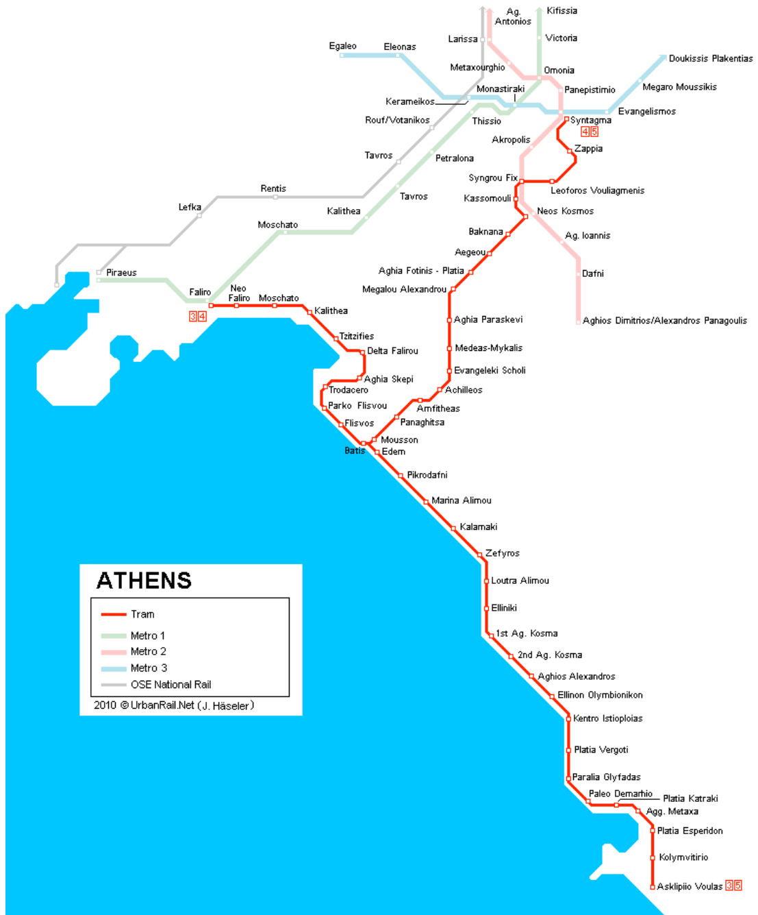
Εικόνα 10. Χάρτης σταθμών του τραμ.

Σχετικά με το τραμ, το χρησιμοποιούν οι κάτοικοι των παραλιακών δήμων περισσότερο για να επισκεφθούν το κέντρο της Αθήνας και αρκετοί από το δήμο Βάρης- Βουλιαγμένης για να φθάσουν στο Παλιό Φάληρο. Συνεπώς οι γραμμές του τραμ εξυπηρετούν μόνο την κατά μήκος διάσχιση της ακτής και την μετάβαση στο κέντρο της Αθήνας, και όχι την μεταφορά εντός δήμου ή από τις γειτονιές στην παραλία.