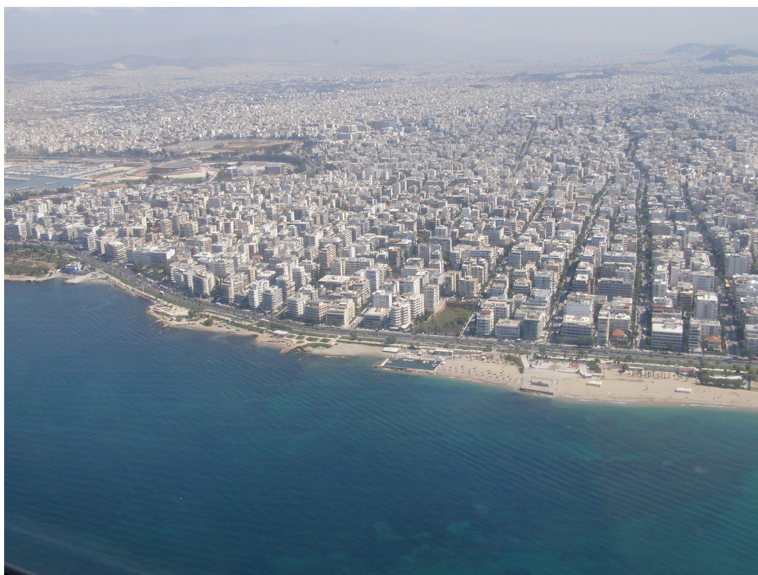
Εικόνα 5. Άποψη του παραλιακού μετώπου του Π. Φαλήρου.

Ο επόμενος δήμος, που βρέχεται από το Σαρωνικό είναι ο δήμος Παλαιού Φαλήρου. Το σύνορό της με το δήμο Αλίμου είναι το ρέμα της Πικροδάφνης. Ο πληθυσμός του είναι 64.759 (2001) με πυκνότητα πληθυσμού 13.636. Η έκταση του είναι 4,6 τετραγωνικά χιλιόμετρα.