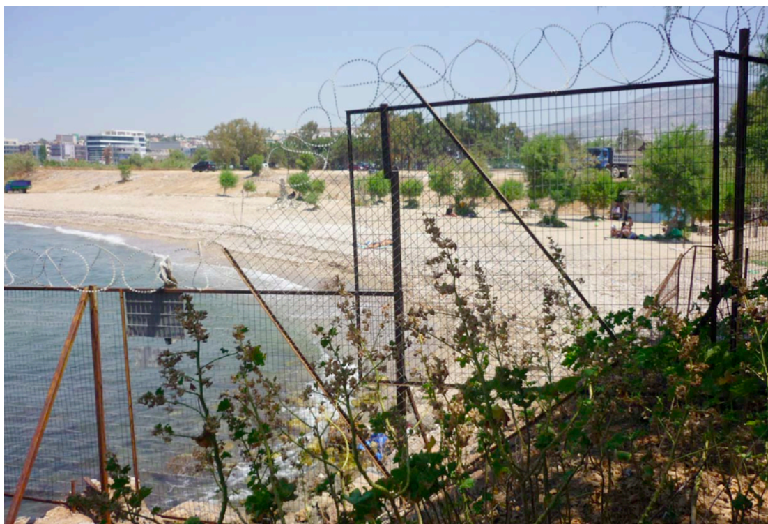
Εικόνα 9. Συρματοπλέγματα και περίφραξη στην παραλία του Αγ. Κοσμά.