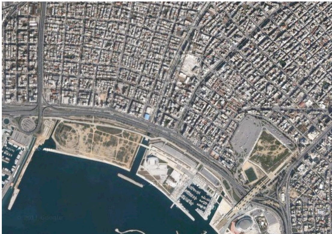
Εικόνα 4. Παραλιακό μέτωπο δήμου Μοσχάτου και δήμου Καλλιθέας.

Το θαλάσσιο μέτωπο του δήμου Μοσχάτου είναι μία ενιαία ακτή, οποία ξεκινάει αμέσως μετά τις εγκαταστάσεις του Σταδίου Ειρήνης και Φιλίας. Προοριζόταν για χώρο πρασίνου και αθλητισμού, χωρίς να έχει υλοποιηθεί μέχρι σήμερα. Υπάρχουν όμως δύο γήπεδα ποδοσφαίρου και καλαθοσφαίρισης.