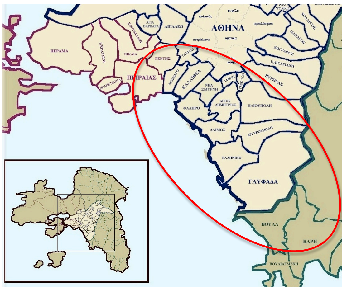
Εικόνα 3. Διοικητικός Διαχωρισμός Αττικής.

Η περιοχή μελέτης, όπως έχει παρουσιαστεί παραπάνω και φαίνεται στην εικόνα, διαρθρώνεται διοικητικά σε επτά δήμους, οι οποίοι θα αναλυθούν στην παρούσα υποενότητα.