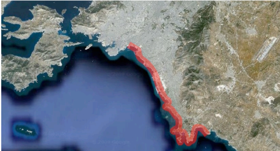
Εικόνα 1. Περιοχή μελέτης.

Ένας ακόμη λόγος, που ενισχύει την άποψη ότι πρέπει το παραλιακό μέτωπο να αντιμετωπίζεται ολοκληρωμένο είναι ότι και στο νέο Ρυθμιστικό Σχέδιο τονίζεται ότι η μελέτη θα καλύπτει το σύνολο της Περιφέρειας Αττικής. Άλλωστε στην Αττική δεν έχει προωθηθεί αυτοτελές πλαίσιο χωροταξικού σχεδιασμού και ανάπτυξης, ώστε να αποφεύγονται οι επικαλύψεις και τα άσκοπα πολλαπλά επίπεδα σχεδιασμού.