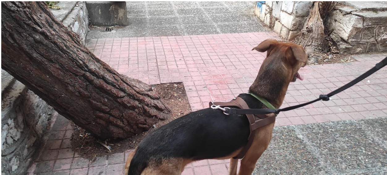
Εικόνα 7: Ο Πάμπλο και το λουρί του. Φωτογραφία της ερευνήτριας κατά τη διάρκεια της συνέντευξης στα Εξάρχεια.