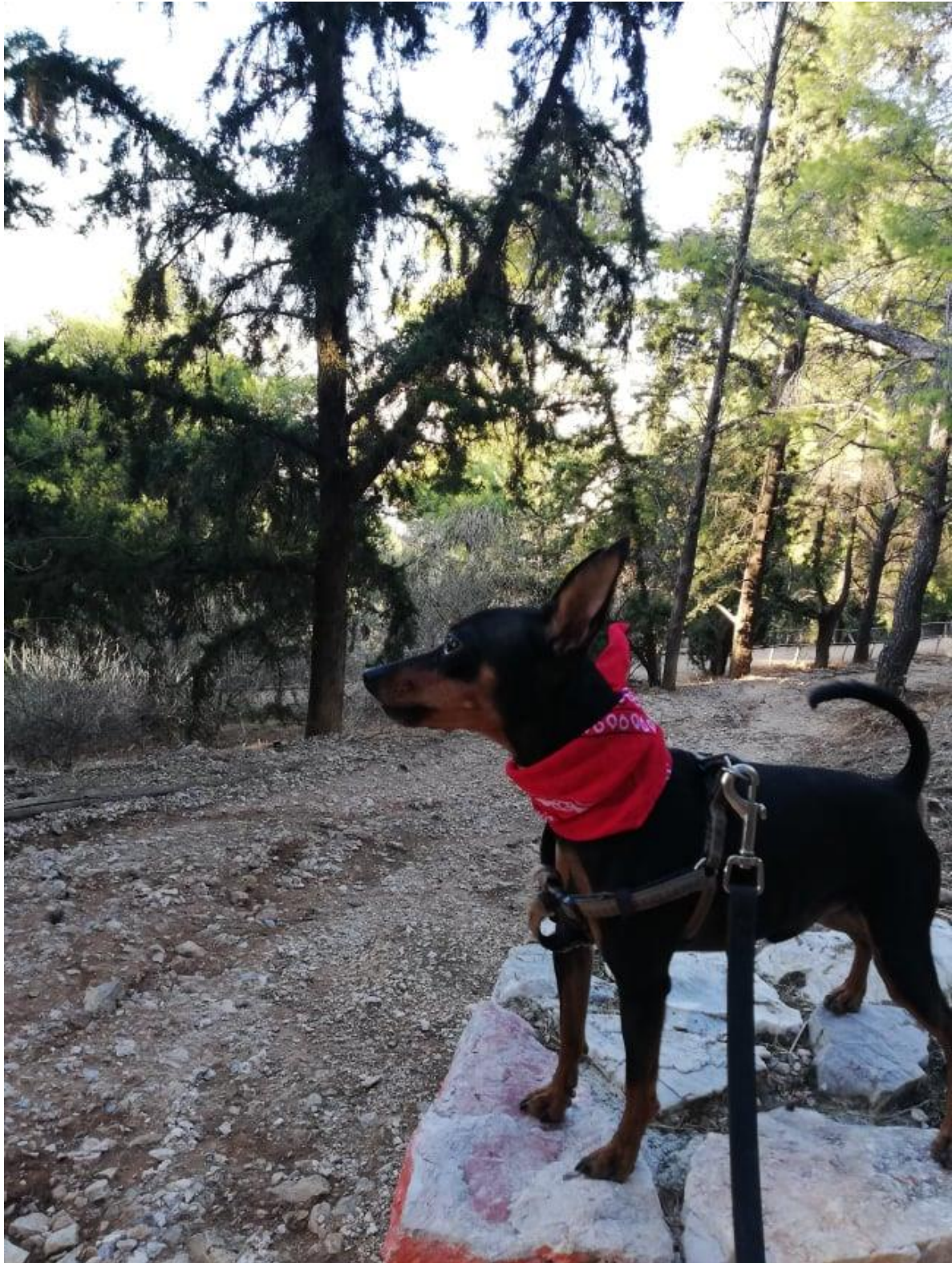
Εικόνα 8: Ο Φρίξος, η σκολία συντροφιά της Χ. σε μία από τις εξορμήσεις του.