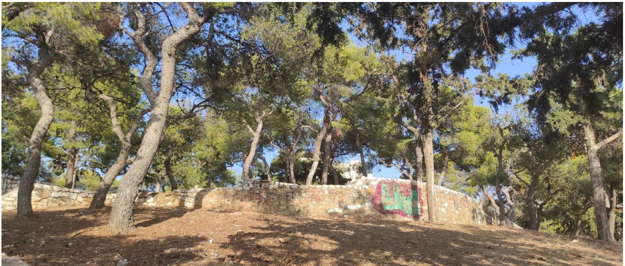
Εικόνα 2: Το σημείο όπου ο Α. και η Ίρις ξεκινάνε την πρωινή τους βόλτα τα τελευταία 9 χρόνια.

Ίρις και Α. ...Πως ξεκινάει η μέρα. Λοιπόν, τη μέρα έρχεται, με σκουντάει. Ντύνομαι σχεδόν αυτοματοποιημένα. Ερχόμαστε εδώ (στο Πεδίο του Άρεως). Αυτό είναι το σημείο το πρωινό. Τώρα το καλοκαίρι αυτά, έτσι. [παύση παρακολουθώντας τις κινήσεις της Ίρις] και εδώ σε αυτές τις πέτρες είναι και ο πρώτος μου καφές εμένα. Δηλαδή ερχόμαστε εδώ για λίγο το απόγευμα. Ε, το καλοκαίρι που δεν είναι τόσο μεγάλες οι βόλτες μας στον ήλιο Εεε, τον χειμώνα βέβαια έχουμε άλλα ωράρια και άλλες συνήθειες. Τον χειμώνα οι βόλτες είναι κανονικές. Ξεκινάνε το πρωί, γιατί έχουμε και πιο εντατική δουλειά, οπότε, οι βόλτες είναι κλασικές, πριν την δουλειά, μετά τη δουλειά το μεσημέρι, και το βράδυ. Αλλά τώρα το καλοκαίρι είναι μία πρωινή, η οποία είναι περίπου μία ώρα βόλτα, και εδώ κοντά (τονίζει), ώστε όταν δω