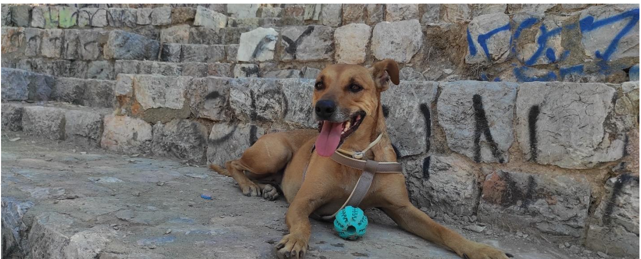
Εικόνα 3: Η Τσοόκο

Τσοόκο και Β. Η ασ πούμε και εκεί στο Πεδίο... που είναι ένα στάνταρ μέρος που μαζεύονται όλα τα σκυλιά. Περνάνε κάτι ηλίθιοι και αρχίζουν και γκρινιάζουνε.