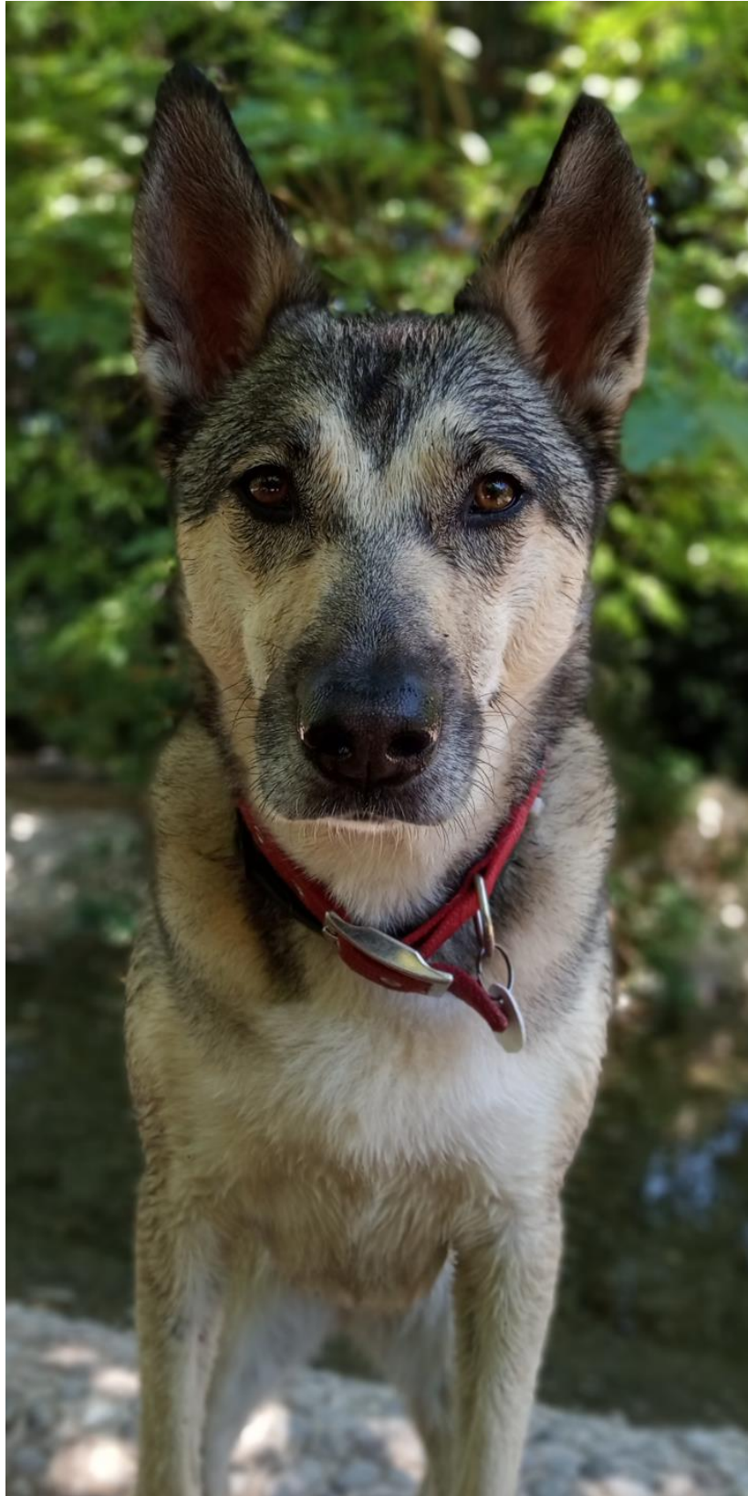
Εικόνα 4: Ίρις, η σκυλίτσα συντροφιά του Α.