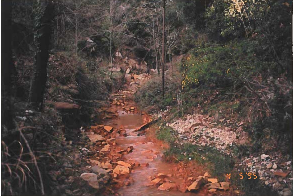
Φωτογραφία II-9: Χρωματισμός της κοίτης του ρέματος με σκουριά από την ΟΑΜ