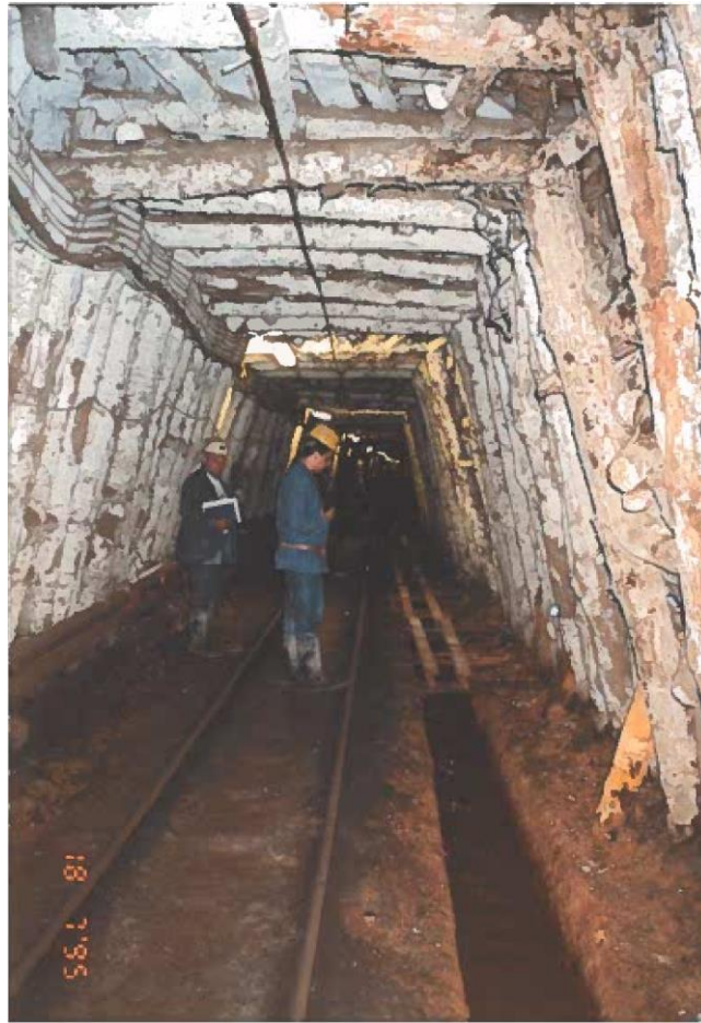
Φωτογραφία II-5: Μεταλλείο Μαντέμ Λάκκου – Απορροές παλαιάς στοάς +63 (έτος 1995)