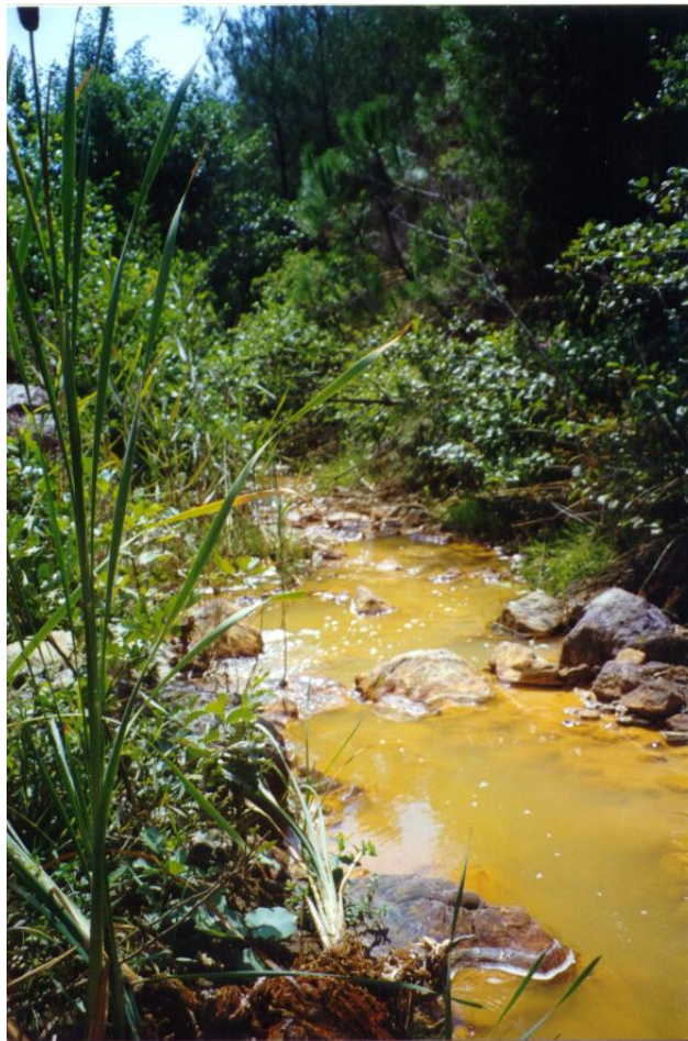
Φωτογραφία II-10: Επιπτώσεις της ΟΑΜ στα ρέματα