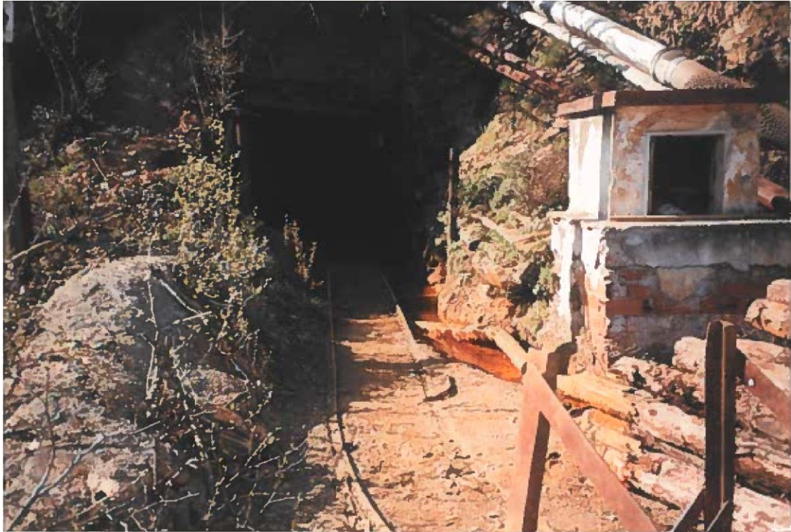
Φωτογραφία Π-3: Μεταλλείο Μαύρων Πετρών – Απορροές παλαιάς στοάς +360 (έτος 1995)