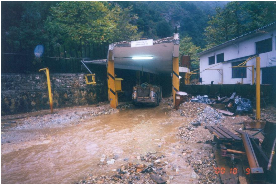
Φωτογραφία Π-4: Μεταλλείο Μαύρων Πετρών – Απορροές στοάς +216 (έτος 2000)