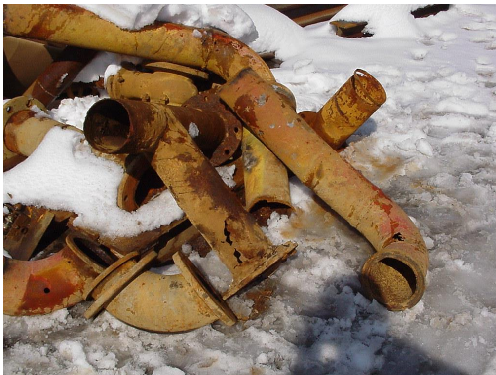
Φωτογραφία II-7: Διάβρωση συστήματος συλλογής και άντλησης της ΟΑΜ