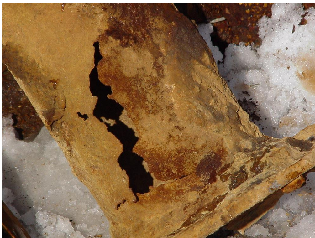
Φωτογραφία II-8: Διάβρωση μεταλλικού σωλήνα συλλογής ΟΑΜ