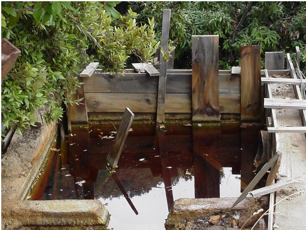
Φωτογραφία Π-2: Μεταλλείο Μαύρων Πετρών - Συλλογή απορροής παλαιάς στοάς +410